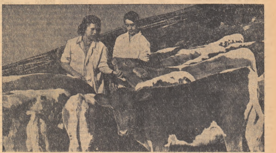
Tot mai mulți tineri din agricultură se conving de însemnătatea sectorului zootehnic al economiei noastre și muncesc cu sîrg pentru dezvoltarea lui. În fotografie: tineri îngrijitori de la ferma gospodăriei zootehnice „Desrobirea” din Botșani, regiunea Suceava, în timpul lucrului.

La 31 octombrie a.c. ora 18,58 racheta purtătoare a satelitului artificial al pămîntului a fost văzută la Observatorul Astronomic din București mișcîndu-se pe o mică porțiune a traectoriei în direcția nord-nord-est, trecînd sub constelația Perseu. La cea mai mare strălucire, racheta a apărut ca o stea de mărimea a doua, de culoare alb-albastră, cu o mișcare mai încetă ca a unui meteor.