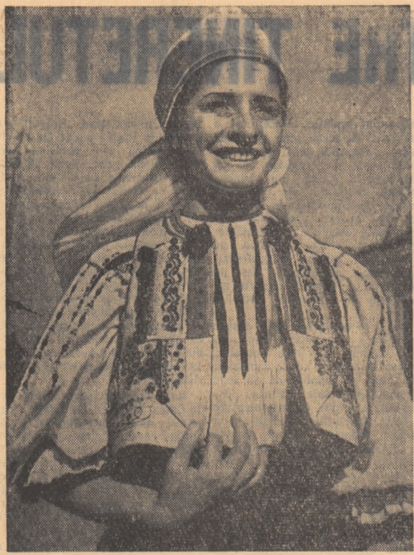
Frumusețea portului popular din raionul Siblu