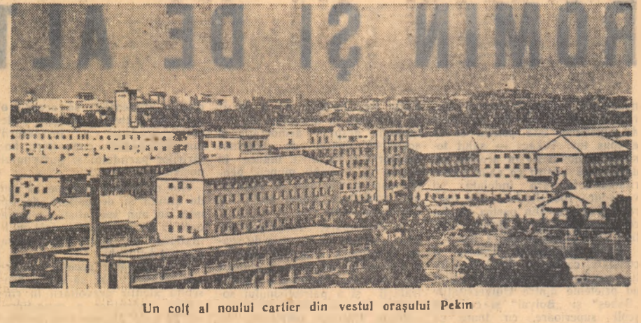
Un colț al noului cartier din vestul orașului Pekin

PARIS 31 (Agerpres). — Felix Gaillard, înscărunțat de președintele republicii, Coty, cu formarea noului guvern, după eșecul lui Guy Mollet, a anunțat miercuri după-amiază că primește sarcina încredințată. Gaillard, care a fost ministru de finanțe în trecut, guvern și a inițiat legile economice care aruncă povara fiscalității excesive pe umerii oamenilor muncii, a început miercuri seara consultările. La 5 noiembrie Gaillard se va prezenta în fața Adunării Naționale pentru a cere votul de investitură.