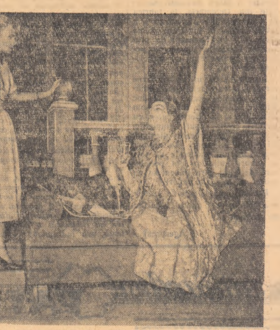
Scenă din spectacolul „Caleașca de aur” de L. Leonov în pregătire la Teatrul Național din București.

Pe această linie se duce în Uniunea Sovietică o mare bătălie nu numai pentru o varietate în tematică, ci și în maniere, în felul de exprimare. Apar noi și bogate căutări pentru găsirea unor noi mijloace vizibile de exprimare. Cele mai bune dintre creațiile din acești ani au arătat fără putință de tăgădă că în arta realist-