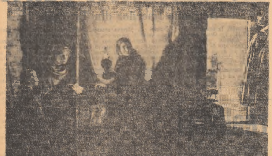
KUKRINIȘI: Ziarul „Pravda” (Din Expoziția de reproducere din arta plastică sovietică de la Casa de Cultură „Friedrich Schiller” din Capitală)

sursa de inspirație, care-i întotdeauna viața în necentenită prefaceră. Se naște astfel nu numai o nouă societate, dar și o artă nouă, socialisă, care prelînd tot ce dăduse mai bun, în dezvoltarea ei de secole, arta răsărită progresivă, își pune cu nobil fel contopirea cu interesele de viață ale poporului în luptă, ale noii clase biruitoare. Revoluția deschide în felul acesta și creației plastice noi orizonturi, mai largi, mai înalte. Milioanele de trudituri trezite la viață li se pune la îndemîna, pentru înția oră în istorie, comorile spirituale făurite de genii creator al poporului. „Arta aparține poporului” spuse Lenin, trăsînd astfel un nou drum, mai rodnic, artiștilor din toate domeniile creației.