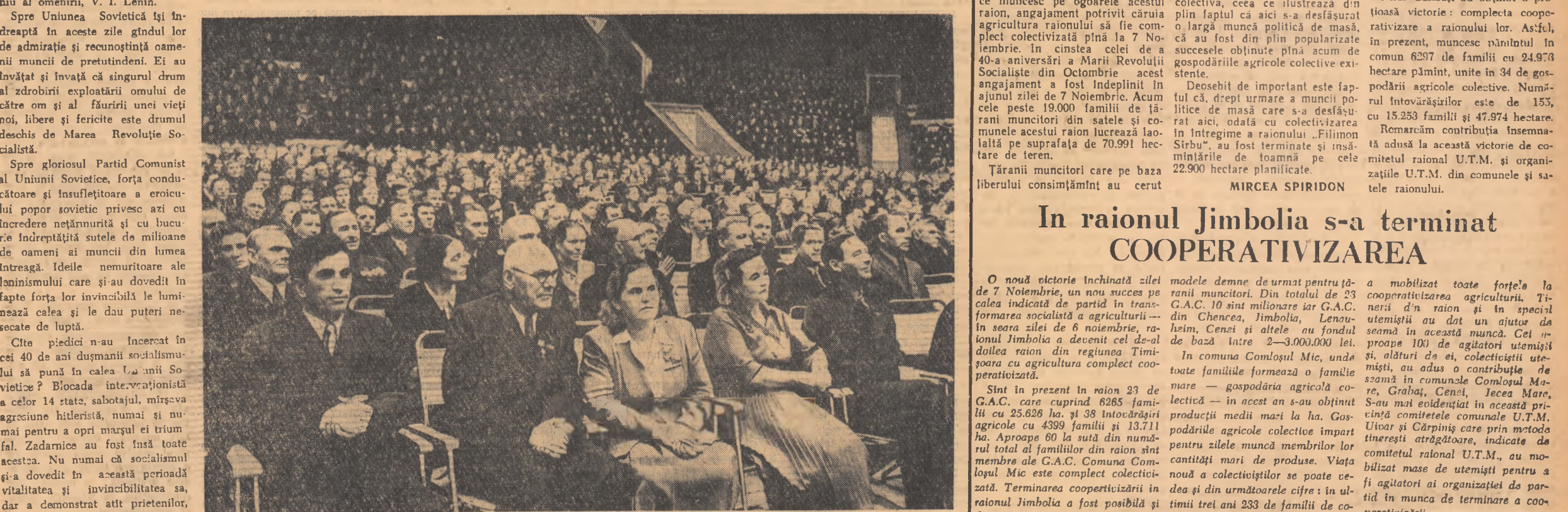
Un aspect din Palatul Sporturilor din Lujniki