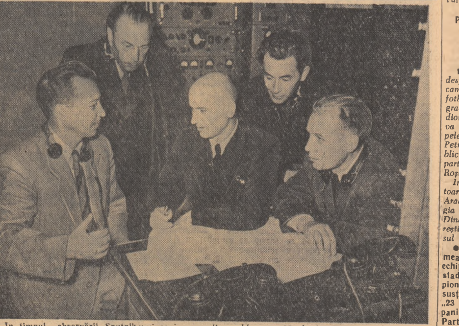
În timpul observării Sputnikului se ivesc multe probleme neprevăzute, pentru rezolvarea cărora este necesară prezența inginerilor radiofoniști.

Cronicarul muzical al ziarului „Liverpool Echo” subliniază în cronica sa că „trumuseța prezintă un entuziasm în ceea ce privește operele lui Dvorak, nu și pe cele ale lui Siivestri”. Simbăz maestrul C. Siivestri va pleca la Paris unde urmează să facă o serie de înregistrări pentru case de discuri franceze.