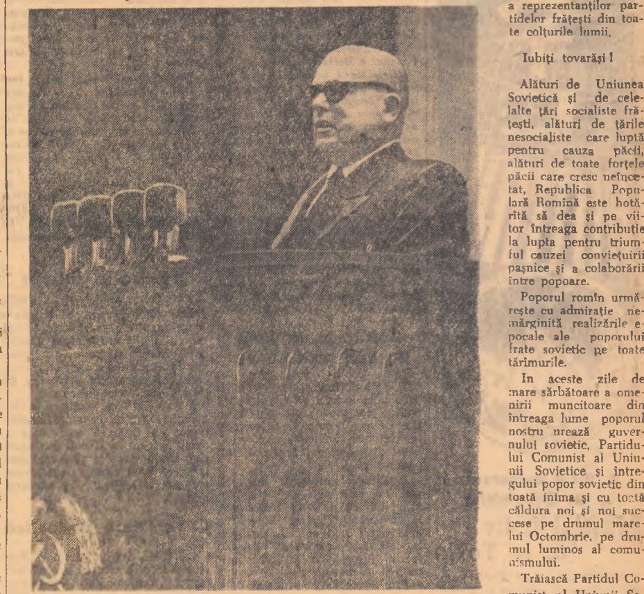
Tov. Chivu Stoica, rostindu-și cuvîntul.

(Urmare din pag. 1-a) constituie pentru noi un înalt acestor decenii de frământări istorice a făcut față tuturor încercărilor, frăție a cărei mînaută manifestă este și întruirea de aici a reprezentanților partidelor frățești din toate colțurile lumii.