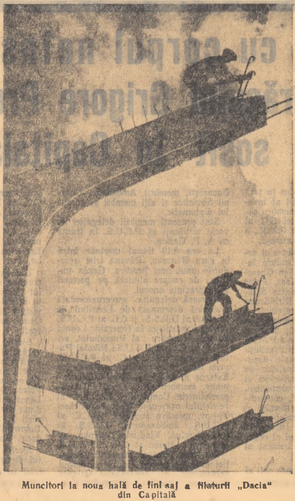
Muncitorii la noua hală de finisaj a fabricii „Dacia” din Capitală