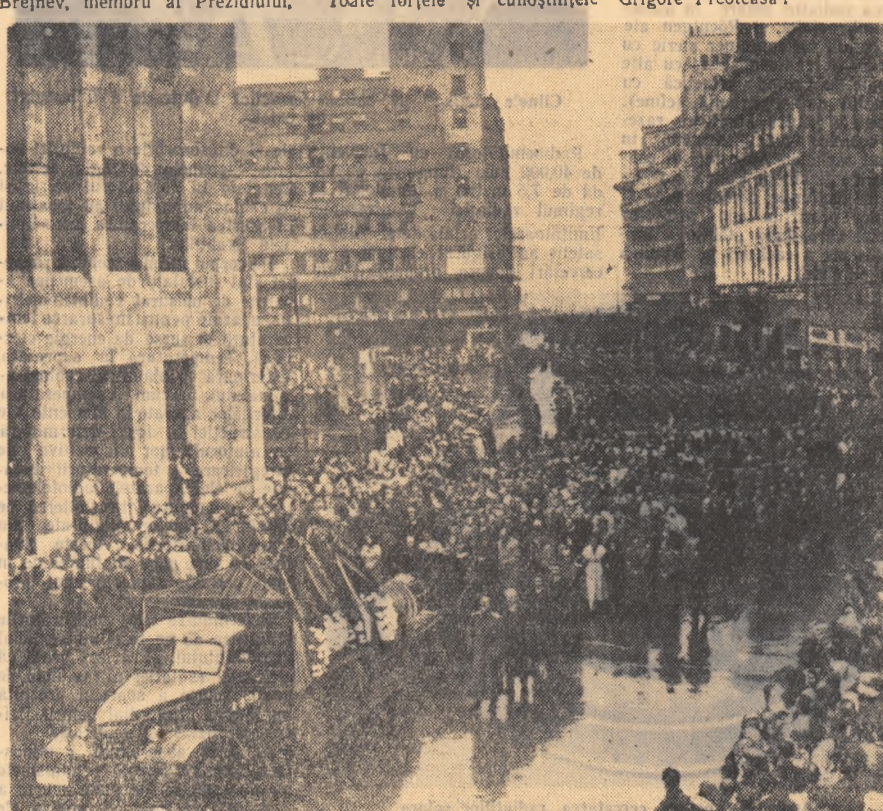
Cortegiul străbate Calea Victoriei