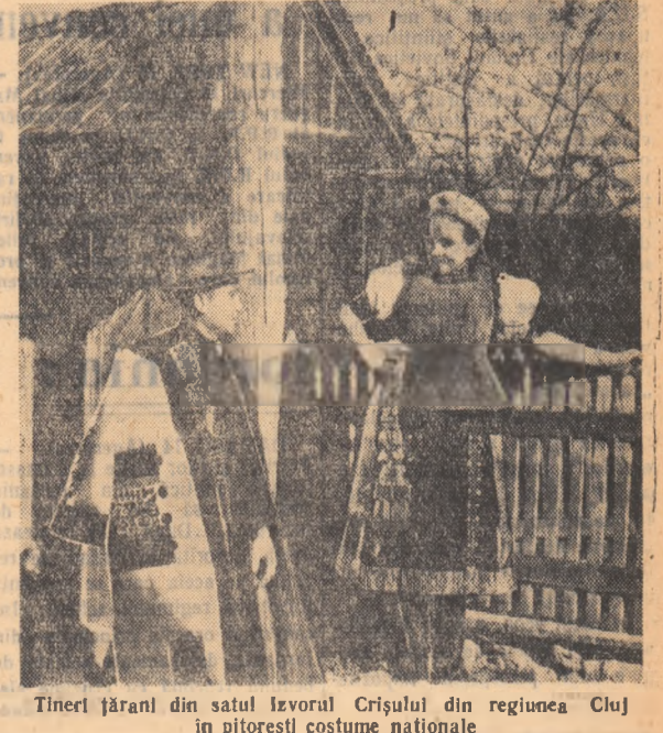
Tineri țărani din satul Izvorul Crișului din regiunea Cluj în pitorești costume naționale.