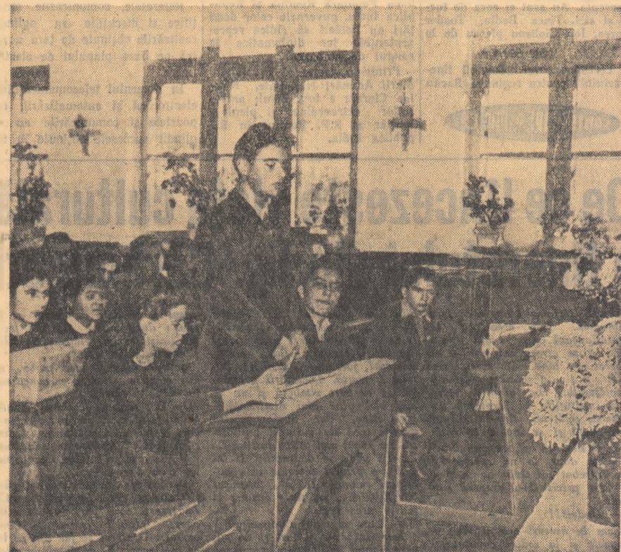
Un aspect de la adunarea de alegeri U.T.M. la Școala medie din Găești

În aceste zile, comitetele raionale și cele orășenești U.T.M., organizațiile de bază U.T.M., trebuie să aibă o grijă deosebită pentru a asigura cercurilor, conferințelor din cadrul învățămîntului politic U.T.M. cele mai bune condiții de activitate, propagandistii de înaltă calificare, o largă participare a elevilor, îndrumare competentă, astfel încît învățămîntul politic U.T.M. să devină o entuziasată acțiune a elevilor noștri, dornici să-și însușească noi și noi cunoștințe politico-ideologice.