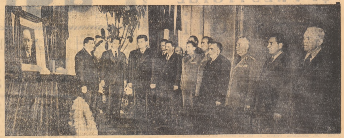
Conducătorii statului, guvernului și partidului nostru după prezentarea condoleanțelor la ambasada R. Cehoslovace