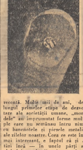
Monedele primitive ale locuitorilor arhipelagului Alor din sud-estul Asiei dovedesc un gust și o tehnică net superioară ambelor populații de mai sus.

Din istoricul schimburilor între oameni, moneda — în forma comodă și curentă pe care o cunoaștem astăzi — este de dată relativ recentă.