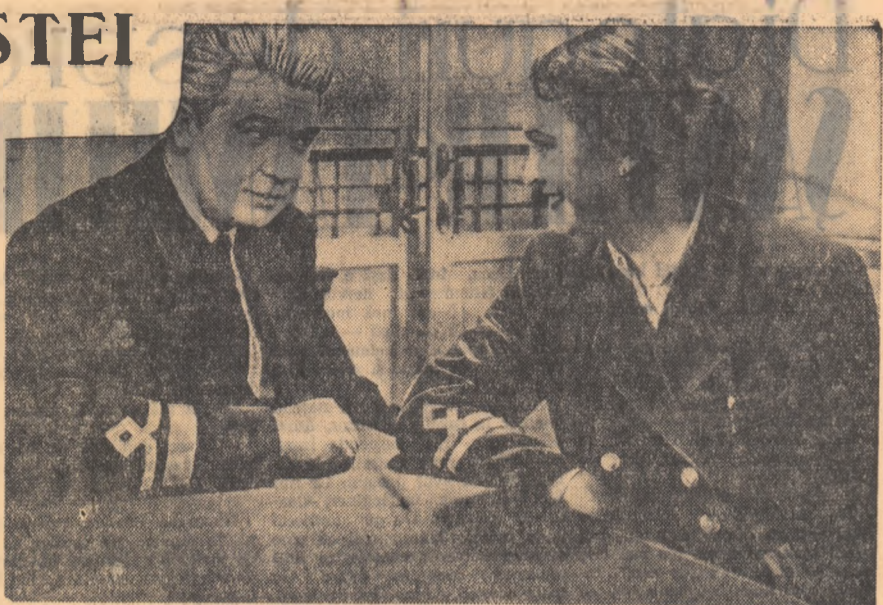
O scena din film