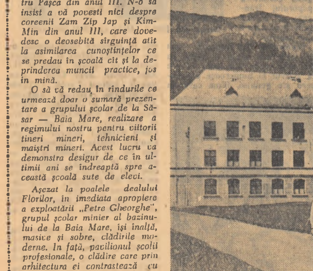
Impunătoarea clădire a Școlii profesionale din cadrul grupului școlar Baia Mare