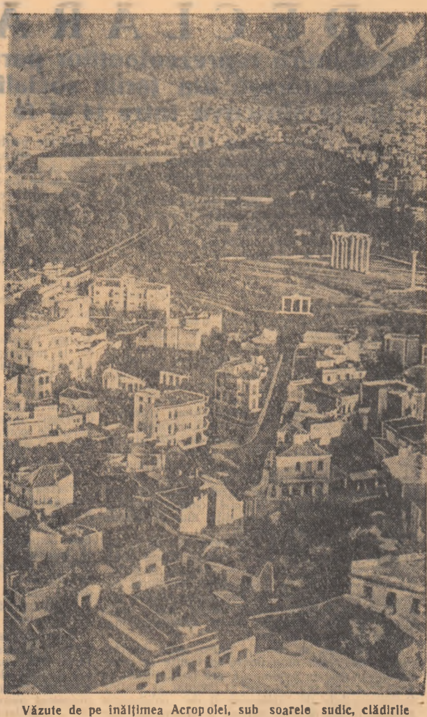
Văzute de pe înălțimea Acropolei, sub soarele sudic, clădirile Atenei se întind pînă departe. In centru, — templul lui Zeus.

Un met alb care încolăcește casca de oțel, un baston de cauciuc strălucitor, un pistol care stă încontinuu la brîu și penultima călcat: la dînză — așa arată noua trupă de elită organizată de ministrul războiului vestgerman. La prima vedere, ei pot fi bine confunziți cu poliția militară americană. De fapt, deosebire nici nu există! Instruiți după modelul poliției militare americane și bazați pe gradul de experiență la care ajunseser jandarmieria fascistă și trupele SS hitleriste, trupa de vînători a lui Strauss urmează să devină șira spinării armatei vestgermane. Instruirea lor ca poliști de circulație nu este decît o preocupare secundară a acestor trupe speciale. In fotografia de sus: Noul polișt militar vestgerman este instruit după metodele fasciste pentru a ști cum să se poarte cu populația civilă. In fotografia din dreapta: Teroarea poliției militare cu trebură s-o cunoască nu numai ciollii, ci și acei soldați care ar îndrăzni să refuze executarea vreunui ordin al N.A.T.O.-ului!