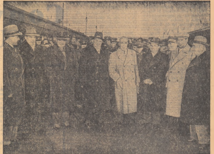
La sosire, pe peronul Gării Băneasa