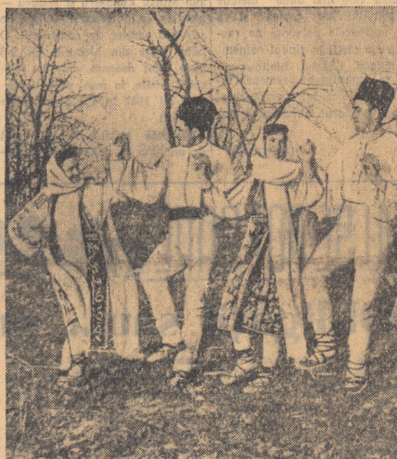
Echipa de dansuri a Căminului cultural din com. Nășăud, repetă în aer liber dansul „De doi”

În gospodăriile colective și întovărășirile agricole din regiunea București se înscriu zilnic peste 350 de familii de țărani muncitori. Cooperativizarea agriculturii a devenit acum obiectul preocupării zilnice a tuturor țărănilor muncitori. O mare parte dintre aceștia se îndreaptă cu încredere către unitățile agricole cooperatiste. În perioada de la 6 la 20 noiembrie, de pildă, mai mult de 5.300 de familii de țărani muncitori, cu o suprafață de peste 15.400 ha, s-au alăturat colectivităților și întovărășirilor. Aceasta a făcut ca procentul de cooperativizare a agriculturii în raionul Urziceni să ajungă la 98 la sută, iar în raioanele Lehliu și Roșiori de Vede la peste 80 la sută. Acum în regiunea București sectorul cooperatist al agriculturii cuprinde peste 45 la sută din suprafața regiunii.