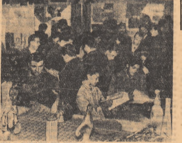
Un colț al expoziției. Ea poate fi vizitată zilnic între orele 10-20

MOSCOVA. — Pînă la 30 noiembrie, ora 6 dimineața, cel de-al doilea satelit artificial a înconjurat pămîntul de 376 ori. Primul satelit artificial al țării noastre, satelitul artificial „Sputnik”, a înconjurat pămîntul respectiv de 851 și 862 de ori.