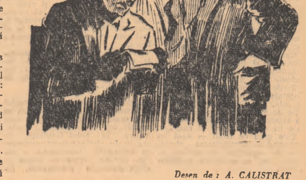
Desen de A. CALISTRAT