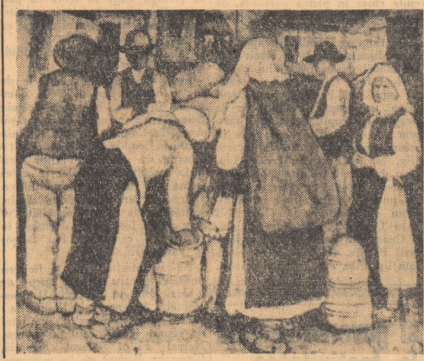
Prin întreaga sa operă, pictorul Ghiață este unul din mari artiști care deosebit de multe de învață.