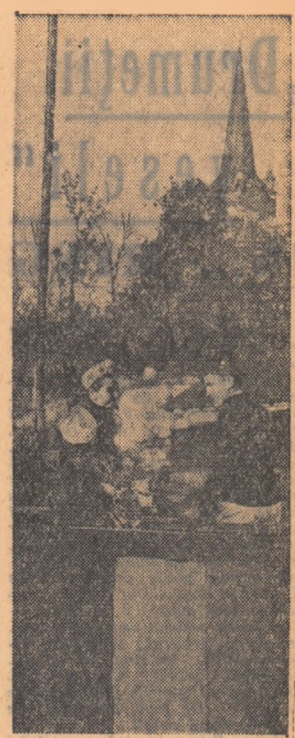
La fîntînă