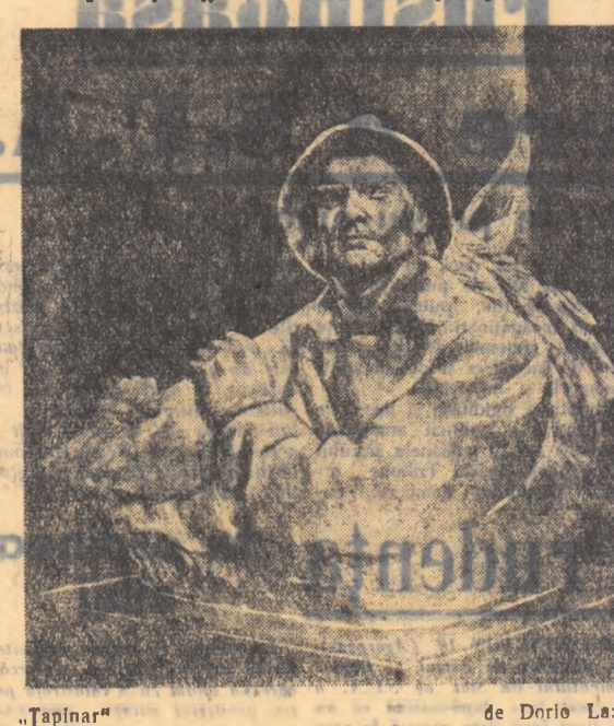
„Tapinar” de Dorio Lazăr