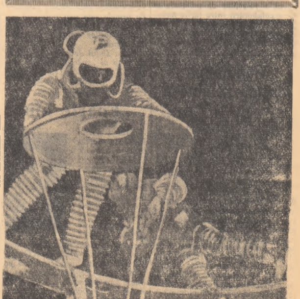
Cam aşa viltoŕii astronautuŕi vor construi o staţie cosmică

Cînd a apărut prima publicaţie medicală în ţara noastră? Sub rezerva unei mai modeste exigenţe în comparaţie cu ceea ce înţelegem astăzi drept publicaţie de specialitate, drept publicaţie medicală, putem afirma chiar că de la apariţia primelor tipăriţi romîneşti de specialitate medicală a trecut mai bine de un secol.