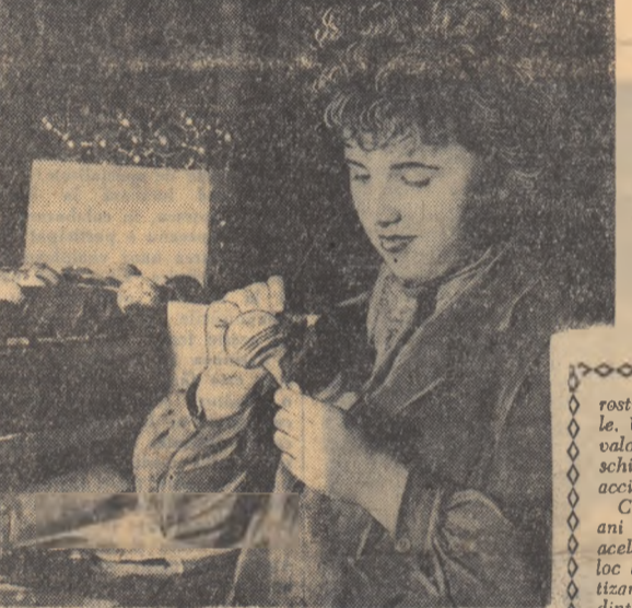
Pentru împodobirea pomului de iarnă la fabrica „Eprubeta” din Capitală s-au produs anul acesta sortimente noi de globuri simple sau cu picturi complicate, virfuri etc.

— În club s-a adus o tablă, un tinăr a tras cu creta, în lat, cinci linii paralele.