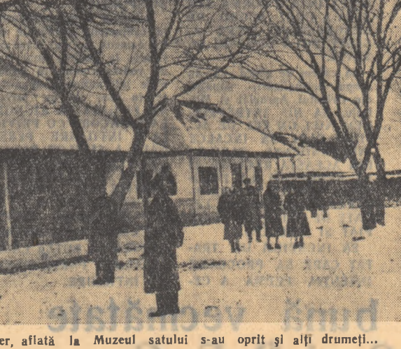
În fața casei lui moș Toader, aflată la Muzeul satului...