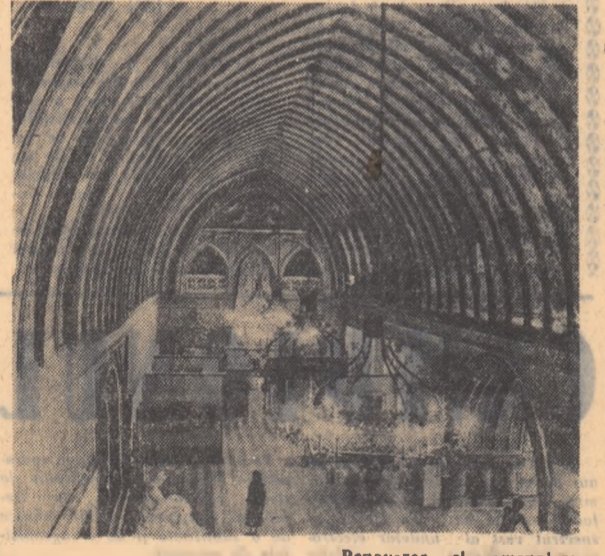
Renovarea și amenajarea clădirii Palatului culturii din Iași a scos mal mult în evidență frumusețea stilului în care a fost clădită.

Între 14 și 23 decembrie se va desfășura în întreaga țară Decada culturii naționalităților conlocuitoare din R. P. Romine.