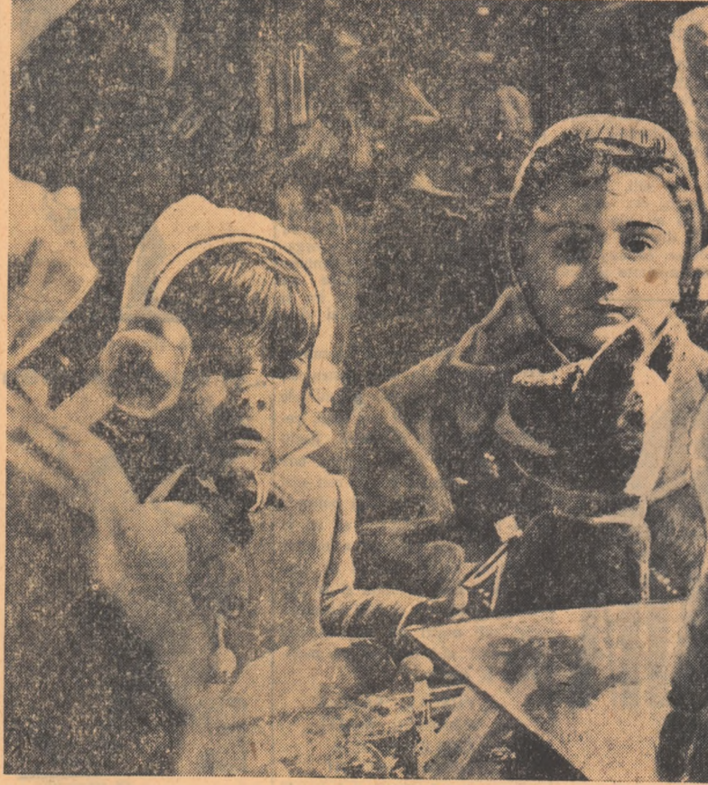
În fața geamului vitrinei eu jucării, născutul ebra devino al mai cîr...