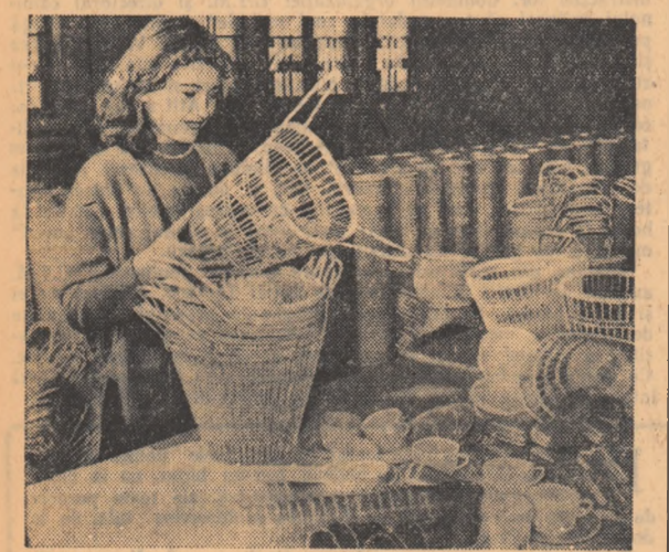
Produsele fabricii de mase plastice din Capitală — dintre care o parte se pot vedea în fotografie — sint foarte căutate.