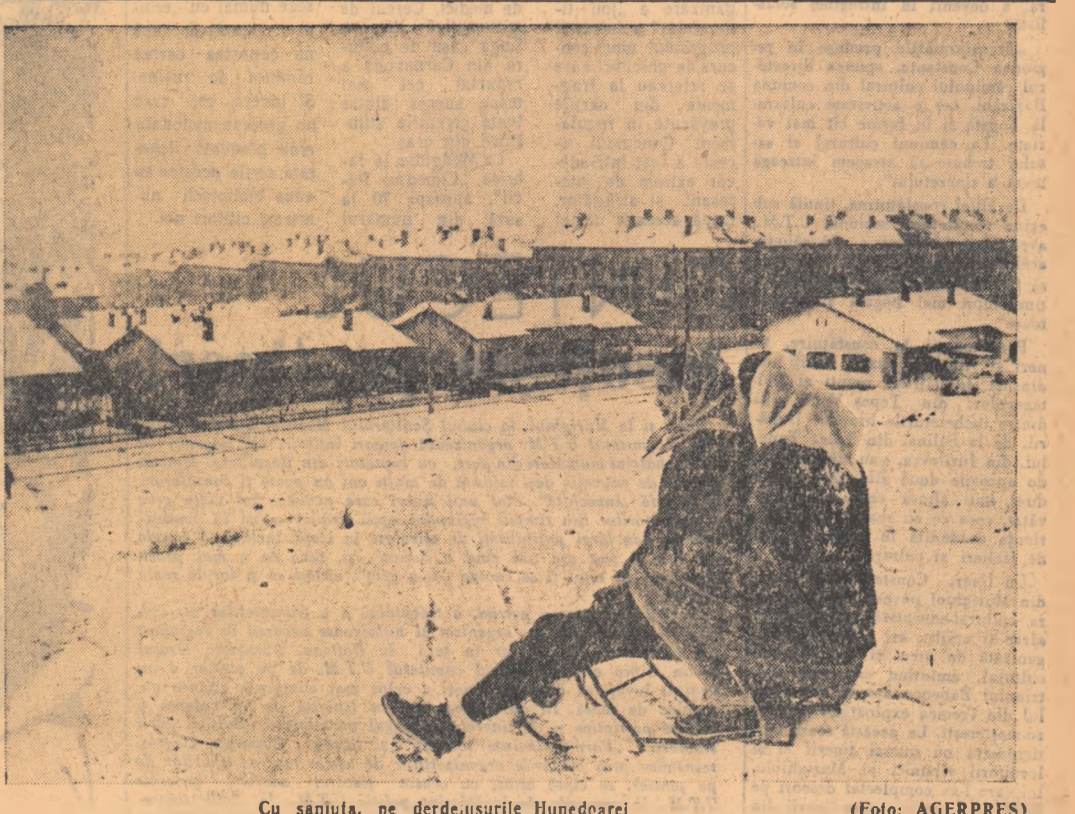
Cu saniașu, pe verde-șuriile Hunedoarei

Fumul bine cunoscutei pipe (una din colecție, de altfel.) a însoțit, ca un comentariu discret, lirismul acestui citat.