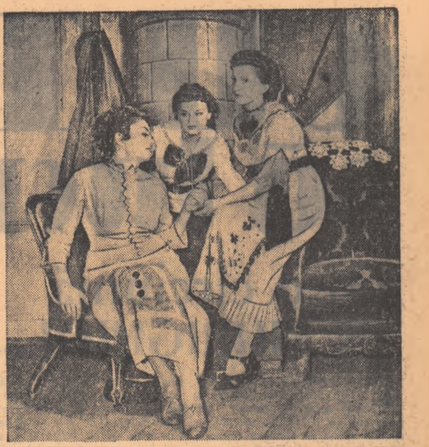
O scenă din piesa „Iubire” de Barta Lajos. În interpretarea colectivului Teatrului Maghiar de Stat din Satu-Mare