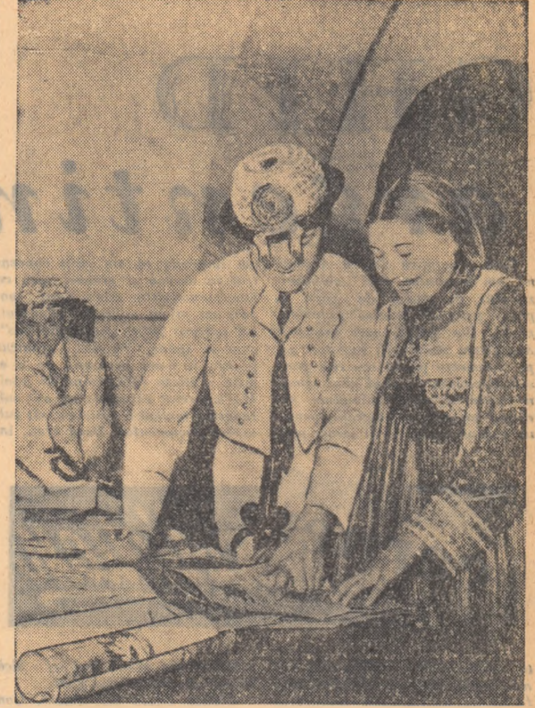
În biblioteca sătească din comuna Vinga, raionul Arad.