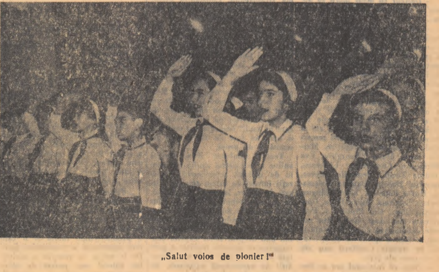
„Salut voies de pionier!”

Vreo 400 de copii, pionieri din raionul „Grivița Roșie” îl așteaptă pe primul secretar al C.C. al U.T.M., tovarășul Virgil Trofin. Cu cîteva zile mai înainte copiii organizati în cîștea celei de-a 10-a aniversări a Republicii. Tovarășul V. Trofin vorbește pionierilor despre trecut. Printre altele vorbitorul a spus: „Negre vremuri erau pe atunci! Cumplită era sărăcia muncitorului și a țărănilor. De undeva, de pe un tron luxos, prințul de Hohenzollern, proclamat „rege” sugea ca o ventuză mîduva țării. „Majestatea sa” primește în dar 13.000 de hectare. O parte din aceste hectare — pămînt arabil, cealaltă parte — pădure. „Majestatea sa” primește „salariu”. E înfricoșătoare o asemenea sumă: bugetul pentru un an și jumătate pentru învățămîntul primar din întreaga țară. „Majestatea sa” ucide 11.000 de țărani în 1907, seri de muncitori și intelectuali în decembrie 1918. „Majestatea sa” își ia tîlpășia. Era la Iași în 1947 cînd s-a proclamat Republica — povestește tovarășul V. Trofin. A fost o veselie nemaiapomenită. În Piața Unirii s-a cîșina hora. Au venit muncitori, intelectuali, elevi. Toți s-au prins în horă. Țara scîpase de ventuză care-i sugea singele. Înima oamenilor era uriașă, plină de bucurie. Pe rege l-au gonit oamenii muncii în frunte cu partidul. Apoi tot oamenii muncii în frunte cu partidul s-au apucat temeinic să construiască republica. Frumoasă și bogată așa cum o vedem astăzi. Tot ce se vede a pentru voi copii — a încheiat tovarășul V.