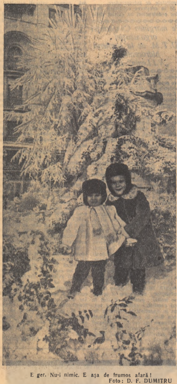
E ger. Nu-i nimic. E așa de frumos afară!

La Viena a luat sfîrșit ședința grupului de inițiativă pentru pregătirea celui de al VII-lea Festival Mondial al Tineretului și Studenților. La lucrările sale au participat frunzași ai vieții publice, oameni de cultură, reprezentanți ai comitetelor naționale ale Festivalului și ai organizațiilor de tineret din 20 de țări, precum și reprezentanți ai F.M.T.D. și U.I.S. La ședința grupului de inițiativă s-a exprimat părerea că este indicat ca cel de al VII-lea Festival Mondial să fie organizat în vara anului 1959. Totuși, hotărîrea definitivă privind data organizării celui de al VII-lea Festival Mondial va fi adoptată de Comitetul internațional de pregătire a cărui sesiune, conform hotărîrii grupului de inițiativă, va avea loc între 20-23 martie 1958. Membrii grupului de inițiativă au hotărîrit să înceteze organizațiile culturale, studențești, sportive, de femei, uniunile de tineret cu diferite orientări politice și religioase, naționale și internaționale, să participe la lucrările Comitetului internațional de pregătire. Pentru pregătirea în vederea sesiunii Comitetului de pregătire a fost creat un grup consultativ din reprezentanți a 16 țări.