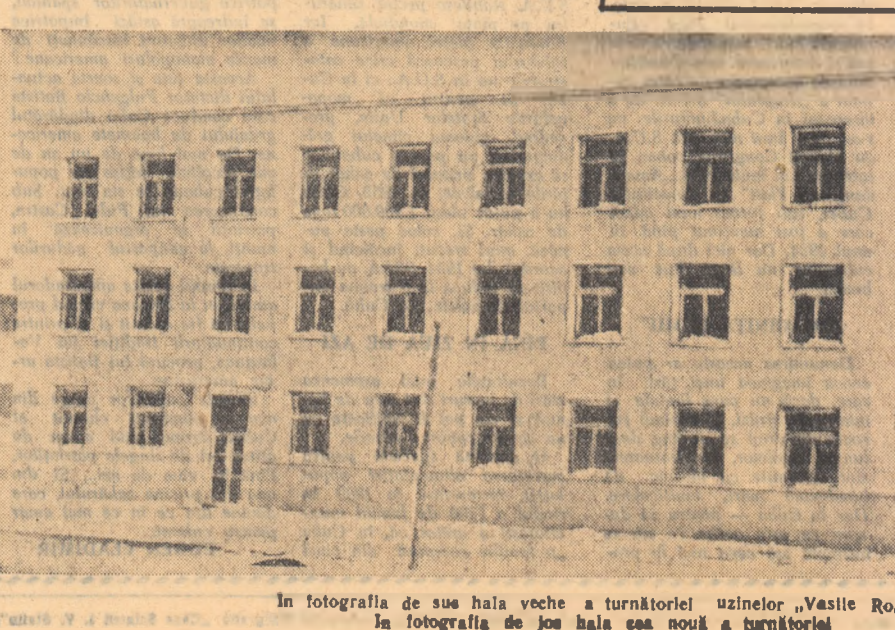
În fotografia de sus hala veche a turnătoriei uzinelor „Vasile Roașă”. În fotografia de jos hala cea nouă a turnătoriei