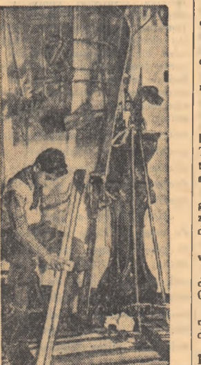
Vine vacanța de iarnă schiurile trebuie puse la punct.

Dansurile pe care le-au prezentat artiștii macedonezi sînt inspirate din viața și preocupările poporului macedonean. Frumusețea dansurilor, suplețea și eleganța cu care au fost interpretate au cules aplauzele entuziaste ale publicului bucureștean. Musica melioasă, originalitatea și varietatea costumelor au contribuit și ele la succesul spectacolului dat de artiștii din țara vecină și prietenă.