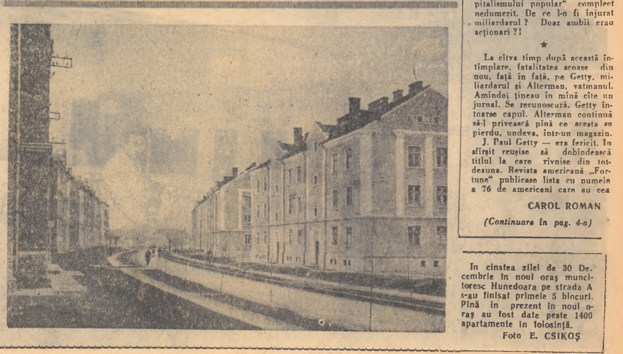
În cîntea zilei de 30 Decembrie în noul oraș muncitoresc Hunedoara pe strada A se află în prezent în blocuri. Pînă în prezent în noul oraș au fost date peste 1400 apartamente în folosință.

— Indiguirea și defrișarea s-a făcut prin muncă voluntară, patriotică pentru țară și tron. Orice intervenție e inutilă, domnule primar. Primarul nu s-a lăsat. — Dar jăranii au semnat domniile director general. Am iscăliturile lor pe liste așa cum a văzut și domnul deputat și domnul senator al nostru. — Care liste? — Listele de plată. De plată, domnule director general... Urmări cîteva clipe de tăcere. Apoi: — Asta e de competența parchetului nu a Ministerului de Interne. — Primarul și-a dat demisia după care a fost internat la spital fiind lovit de damba. Maiorul a băut trei zile și trei nopți în șir. Dar nu a căde. Consilierul, deputatul și