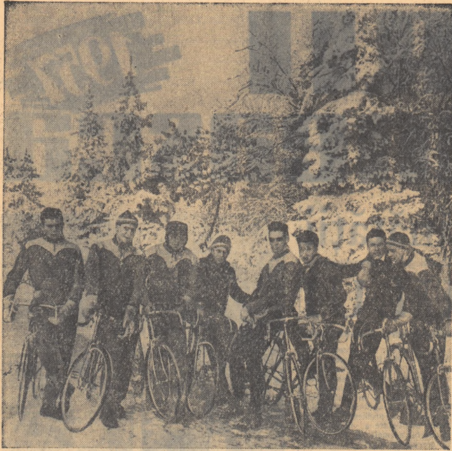
Un decor puțin obișnuit pentru ciclism. Cu toate acestea reprezentativă de tineret a țării noastre se pregătește asidu pentru Turul ciclist al Egiptului.