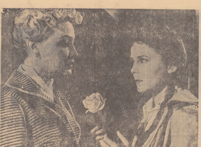
O scenă din filmul „Un om obișnuit”