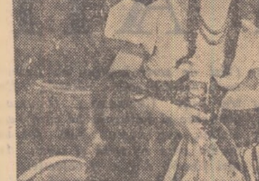
O scenă din filmul „Cinematograful de altă dată”