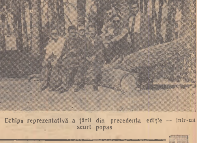
Echipa reprezentativă a țării din precedenta ediție — într-un scurt popas

din cele 7 cite numără Nilul pe parcursul său. De la Luxor, unde startul se va da în cadrul unei fastuoase serbări, din care nu lipsește demonstrația ale tineretului, îmbrăcat în vechi și pitorești costume egiptene, dănsind în sunetele muzicii orientale, caravana ciclistă se va îndrepta spre Kenia, apoi spre Soha și Assiut.