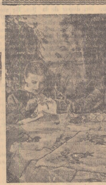
Copiii de la Școala elementară de 7 ani din Dej lucrează cușă turli folosind izvoada.