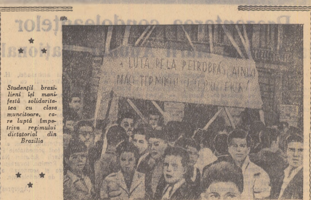
Studenții brazilieni își manifestă solidaritatea cu clasele muncitoare, care luptă împotriva regimului dictatorial din Brazilia