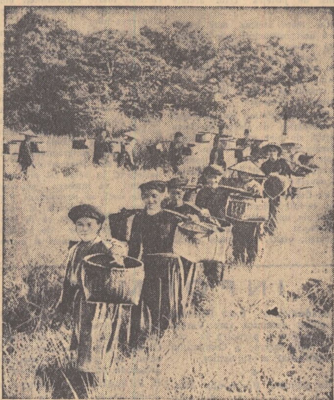
Membrul unei cooperative agricole din Vietnam la culesul recoltii

Ziarul „Times of India” a publicat acest comunicat în prima pagină sub titlul mare: „Reducerea forțelor armate sovietice cu 300.000 de oameni. Un apel adresat Occidentului de a urma acest exemplu”.