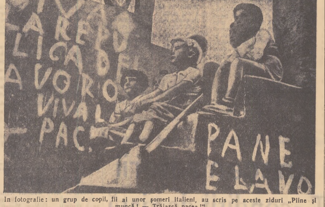
In fotografie: un grup de copii, fii ai unor șomeri italieni, au scris pe aceste ziduri „Pline și muncă! — Trăiască pacea!“

Concertul s-a bucurat de o primire entuziastă din partea publicului; care a bisat și chemat la rampă de nenumărate ori pe dirijor. Intregul concert a fost retransmis de posturile de radio din Moscova.