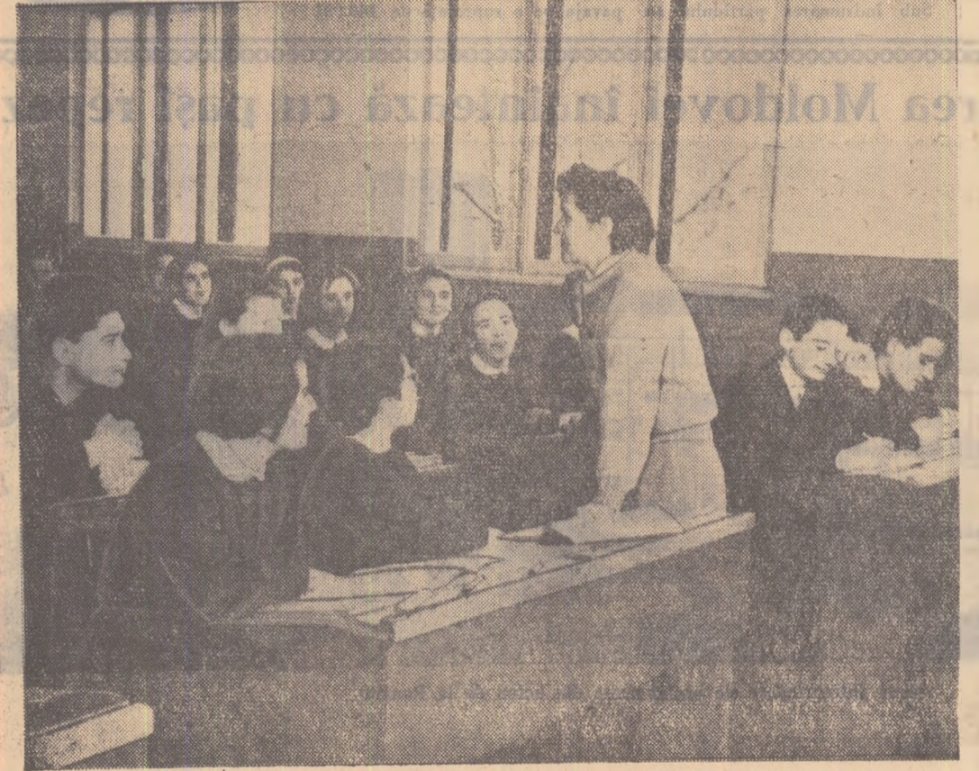
Un grup de elevi în sala de clasă.