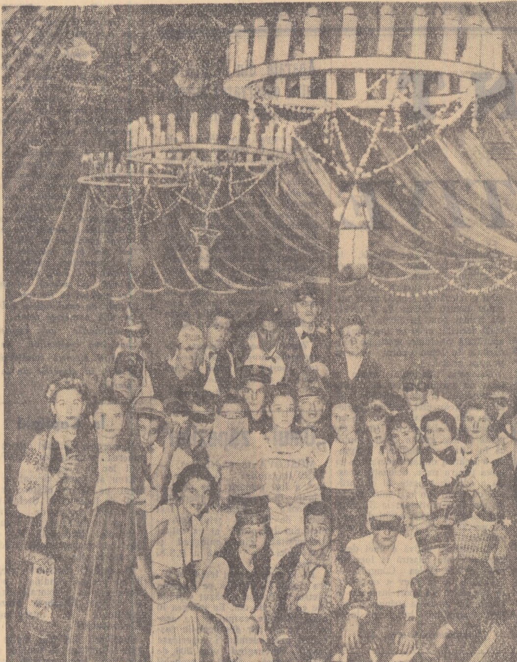
Un aspect de la carnavalul elevilor care a avut loc la Palatul Pionierilor din București.