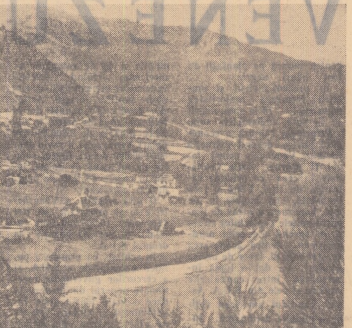
Vedere generală a satului Săvi nești, comuna Galu din raionul Cealhan. Nu departe de locurile asupra cărora a fost îndreptat obiectivul fotografic se înalță semeț și neclintit de vremuri, Cealhanul, martor al transformărilor ce se petrec în albia bătrînei Bistrița. Într-o bună zi în căsuțele vopșite albe și albastre ale satului, Hidrocentrula „V. I. Lenin“ de la Bicaz va da primele licăriri electrice.

După un an de muncă, s-a constituit și alte acțiuni și inițiative în