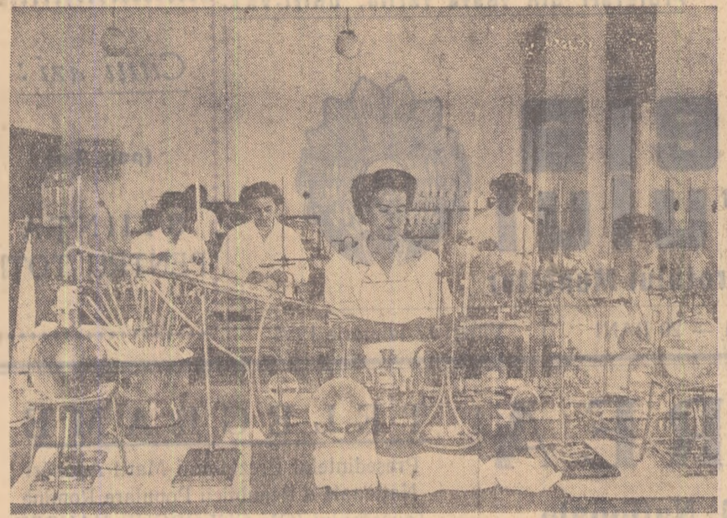
Anii pterilor populare au transformat în un puternic centru de cercetări științifice.