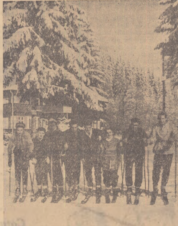
Sute de elevi și-au petrecut, anul acesta, vacanța de iarnă în cele mai frumoase regiuni ale țării. La Homorod sau Sovata ei s-au bucurat de condiții minunate, s-au întrecut în concursuri literare, artistice și sportive. In fotografie: Un grup de elevi în tabără la Homorod.

Experimentarea învățămîntului politehnic s-a introdus în școala noastră odată cu începerea anului școlar 1955/1956, cînd o clasă formată din 43 elevi a început să lucreze în atelierul școlii al Atelierei „Grivița Rosie”. Astăzi, în al III-lea an de experimentare a învățămîntului politehnic, în afară de clasa arătată mai sus, 360 elevi din clasele VIII și aproape 400 de elevi din clasele IV lucrează în atelierele de instrucție din incinta Atelierei „Grivița