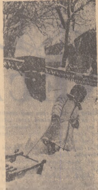
Zăpada e mare și plînă i derdeluș mare e de tras.

mult mai mare de zile muncă decît baremul stabilit de adunarea generală a colectivștiilor. Pentru a lega mai bine munca organizațiilor U.T.M. de activitatea de producție, în această gospodărie au fost create organizații U.T.M. pe brigăzi de cîmp, organizații care au drepturile și îndatoririle unei organizații de secție. În felul acesta s-a reușit să fie atrași toți utemiștii la adunări, să discute temeinic problemele de la locul lor de muncă etc. Întărirea de organizații U.T.M. pe brigăzi s-a dovedit a fi binevenită și noi studiem posibilitatea generalizării acestei experiențe și în alte gospodării colective unde sînt peste 100 de membri. Organizația U.T.M. de aici simte și ea răspunderea pentru dezvoltarea pe mai departe a gospodăriei. Și dacă în 1957 cele aproape 2.000 hectare de pîmînt, livada, îngrășătoria de porci, mater-nitatea, căii, gaterul, cele 4 auto-camioane și 2 rutiere și multe altele, au adus gospodăriei veniturii