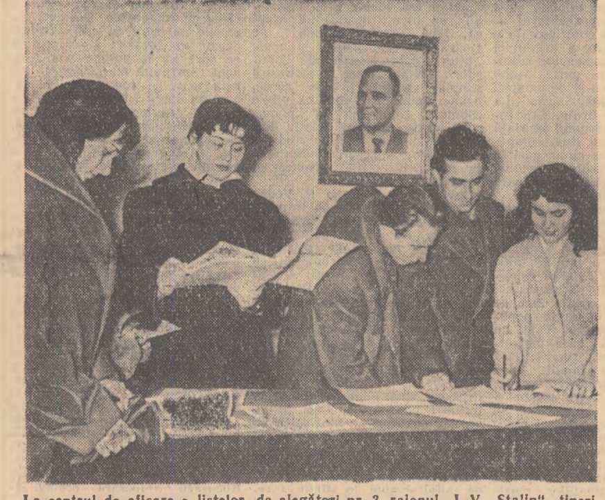
La centrul de afișare a listelor de alegători nr. 3, raionul „I. V. Stalin“, tineri și tinere vin zilnic să verifice înscrierea lor în listele de alegători.

Vineri duă amiază a avut loc la combinatul metalurgic din Reșița o consfățuire la care au participat numeroși muncitori tineri și vîrstnici. Ingineri și tehnicieni din combinat, precum și cadre de conducere ale combinatului metalurgic. În cadrul consfățurii s-a dezbătut o problemă deosebit de importantă și anume economisirea metalelor. Analizînd posibilitățile existente, tinerii siderurgisti și metalurgisti din Reșița, în frunte cu utemiștii, au luat o frumoasă inițiativă. Ei s-au angajat să economisească anul acesta 3.000 de tone de metal. Totodată ei au adresat tineretului din toate întreprinderile metalurgice și siderurgice din țară o chemare pentru economisirea a cît mai mult metal. Pentru realizarea angajamentului luat, tinerii și-au propus să pună în aplicare o serie de măsuri tehnico-organizatorice care le vor permite să gospodărească cu grijă metalele. Pornind această inițiativă tinerii reșițeni și-au exprimat convingerea că în fiecare întreprindere metalurgică din țară există posibilități de economisire a metalelor. Folosind fiecare gram de metal lătat ca prin aceasta să influențeze mersul normal al producției tinerii din întreprinderile metalurgice și siderurgice din țară se vor alătura și ei acestei inițiative. În acest fel se va înălțura rîspunderea metalelor sub orice formă, fapt care va da posibilitatea sporirii producției în industria constructoare de mașini. (Agerpres)