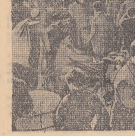
O demonstrație studențească împotriva colonialismului

trupelor străine de pe teritoriul țării. Abia de aici înainte s-a fost posibilă dezvoltarea și a învîlmîntului. Au fost deschise școli, de toate felurile, iar la Damasc s-a înființat Universitatea siriană, cu facultăți de medicină, drept, științe, literă etc. La Alepp, a fost înființat un institut politehnic care urmează să fie înălțat în viitoare universități. A crescut numărul studenților. Procentajul oamenilor cu nivel de cultură a crescut odată cu creșterea rolului lor în construirea unei noi societăți. A început să se cristalizeze și mai mult o mișcare studențească activă, organizată. Apar tot