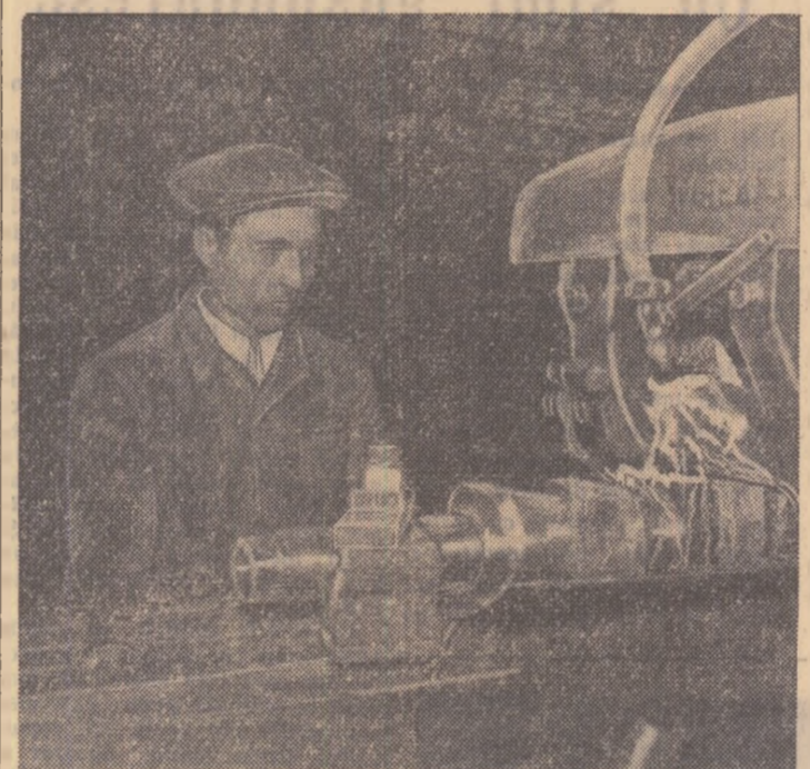
Muncitorii frezor Mosor Frății de la uzinele Timpuri noi, propus candidați al F.D.P. în circumscripția electorală regională nr. 63.