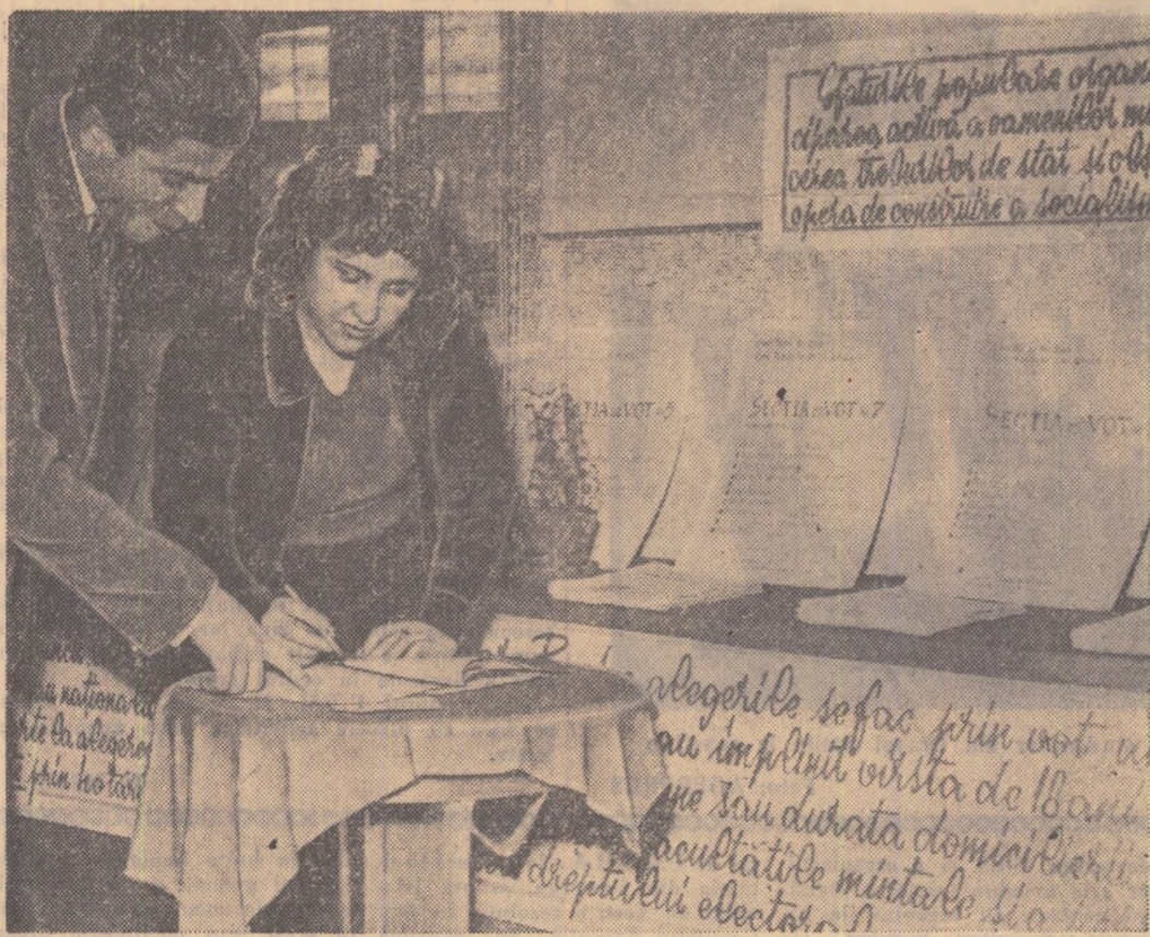
La centrul nr. 1 din raionul N. Bălcescu din Capitală cetățenii verifică dacă au fost înscrși în listele de alegători