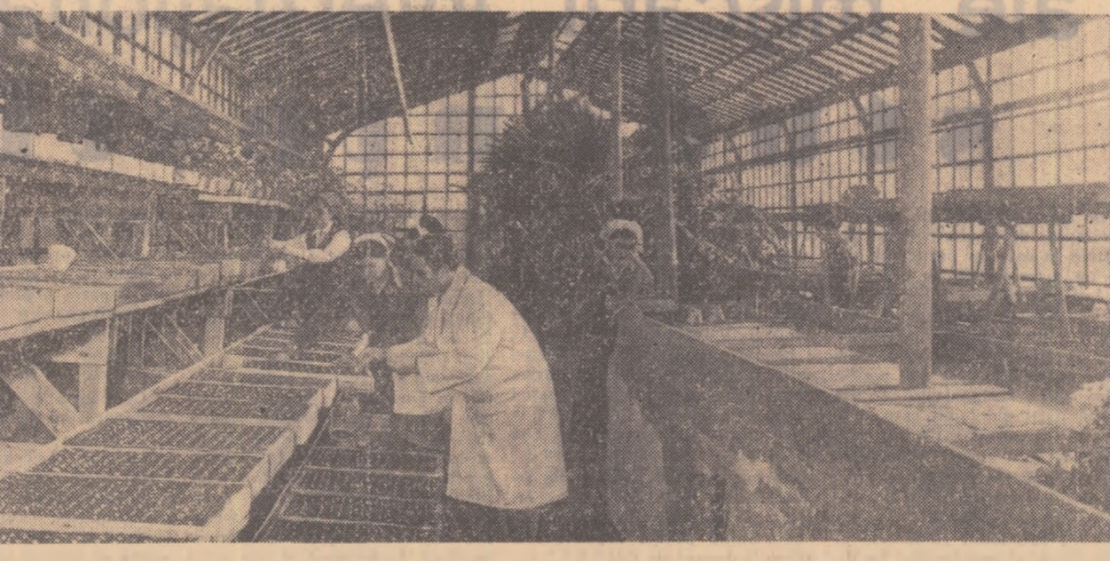
Imagine din noile sere construite la Pitești, unde se vor cultiva peste 2 milioane de plante necesare ornamentării orașului

Bilanțul primei luni a anului 1958 în industria metalurgică s-a încheiat cu noi succese în producție ale muncitorilor din această ramură importantă a economiei noastre naționale. La coes metalurgică s-a realizat o depășire de 5.100 tone. Din rîndurile întreprinderilor siderurgice care au produs în total peste plan 3.250 tone tuncie s-a evidențiat Combinatul Siderurgic Hunedoara. La oțel Martin planul pe luna ianuarie pe întreaga industrie siderurgică a fost depășit cu 2.600 tone, iar la oțel special cu 200 tone. De asemenea planul de producție la laminate a înregistrat o depășire de 2.700 tone; aceasta se datorește în primul rînd rezultatelor bune obținute de muncitorii Combinatului metalurgic Reșița și uzinei Industria Sirmii din Cîmpia Turzii. Vestile privind producția pe primele zile ale lunii februarie anunță noi depășiri de plan realizate de muncitorii siderurgicști.