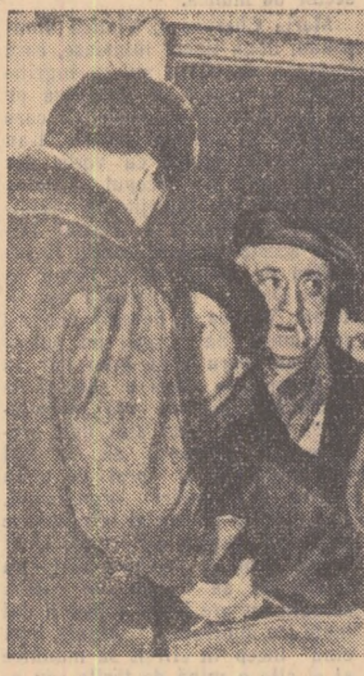
... (caption text not fully visible)