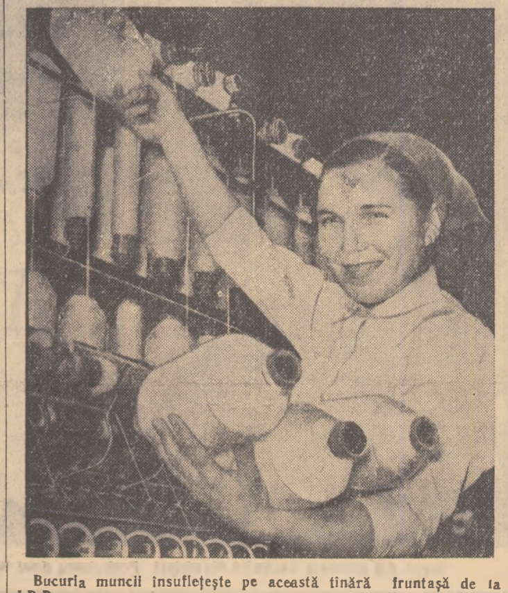
Bucuria muncii însuflește pe această tină frunză de la I.B.B.