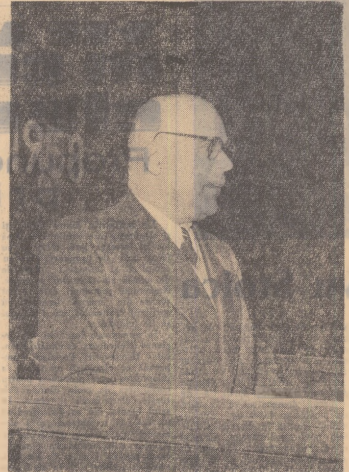
tatea și celelalte pături muncitoare ale poporului.

jurul el toate forțele patriotice ale poporului în lupta pentru răsturnarea stăpînirii burghez-mosieresti și asigurarea dezvoltării democratice a țării. Cauza pentru care a luptat clasa muncitoare în anii regimului burghez-mosieresc și pentru care s-au jertfit eroii luptelor de la Grivița a biruit în țara noastră. Poporul nostru, cu ajutorul Uniunii Sovietice, și-a cucurit o existență liberă și independentă lîndu-și soarta în propriile sale mîini. Clasa muncitoare și-a îndeplinit cu cinste sarcina de stegar al maselor populare în lupta pentru înfaptirrea însușirii armate de la 23 August 1944 și sprijinirea prin toate mijloacele a frontului anti-fascist, pentru refacerea țării și înfrîngerea partidelor burgheze reacționare, pentru instaurarea regimului democrat-popular și trecerea la construirea socialismului. În focul acestor aprige lupte de clasă s-a făurit alianța muncitoare-clasă-țărănescă, sub conducerea clasei muncitoare și a partidului ei. În jurul clasei muncitoare și-au strîns rîndurile intelectuali-