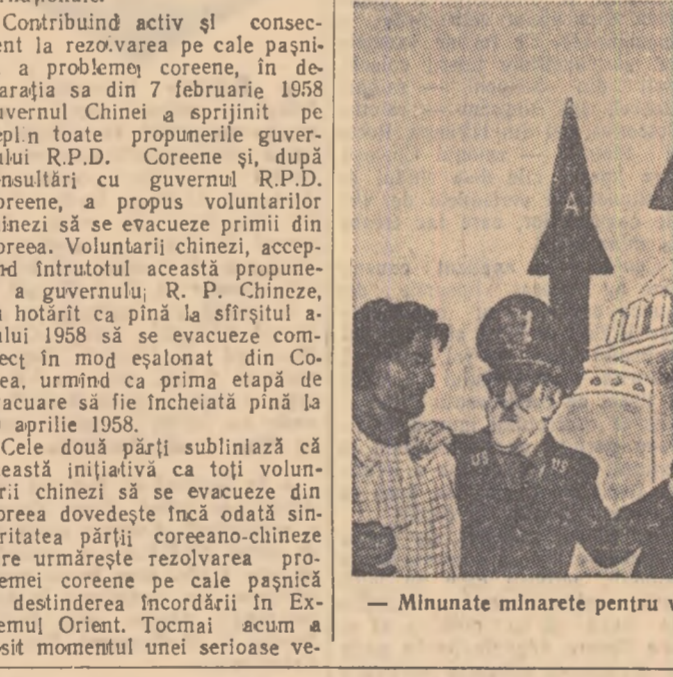
Minunate minarete pentru vechea voastră moschee, nu-i așa? Din „KROKODIL”

După MacMillan a luat cuvîntul la dezbateri liderul opoziției laboriste, Hugh Gaitskell, care a cerut guvernului „să cadă imediat de acord cu privire la convocarea unei conferințe la nivel înalt. Cel mai tîrziu această conferință ar trebui să se țină în iunie, iar Geneva ar fi un loc potrivit”.