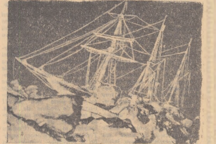
Multe asemenea vase au eșuat pe drumul străbătut de Amundsen

Amundsen epopee a lui Amundsen datează de acum 55 de ani. La 17 iunie 1903, opt oameni se imbarcă pe un vechi vas de pescari pentru o expediție în imensitatea rece a nordului. Roald Amundsen era șeful