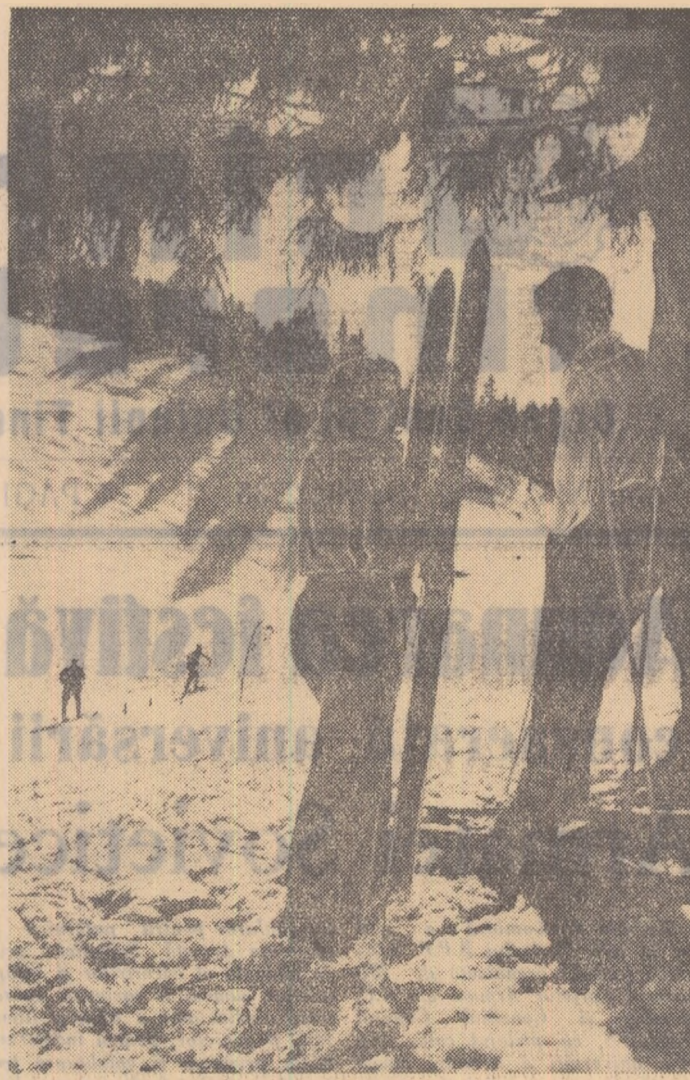
Munții inălbii — prieteni dragi ai tineretului

În scosă zi de sărbătoare, oamenii muncii din țara noastră și militarii Forțelor Armate ale R.P.R. trimisii acestor sovietici un frîșes și cordial salut și urările lor pentru obținerea de succes tot mai mari în pregătirea de luptă și politică. Militarii armatei noastre sînt mîndri de frația de arme cu eroica Armata Sovietică, cîmăntată prin singele vîrșat în comun, în luptele pentru nimicirea fascismului, și sînt hotărîți să o dezvolte și să o întărească tot mai mult, în interesul popoarelor noastre, a cauzei păcii și socialismului.