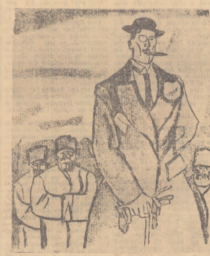
I. ISER „Foaia” — 1912.

cial în cartierele periferice a răzărât scandal, și deodată lucrurile s-au potolit de parcă n-a fost acest apel la obolul cetățenilor unde furtișagurile au devenit publice se face o anchetă. Inculpatul