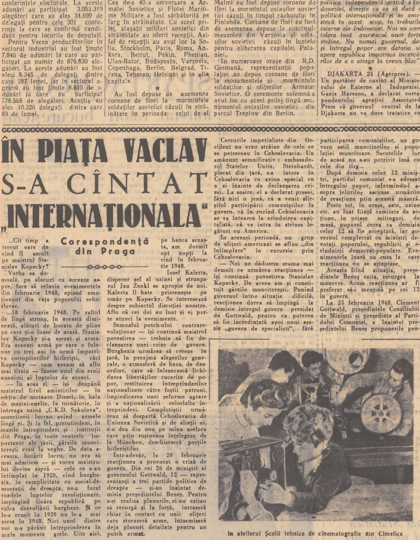
În atelierul Școlii tehnice de cinematografie din Cîmpulung

BELGRAD (Agerpres). Agenția Taniug transmite ultimele date ale Comisiei Federative Electorale.