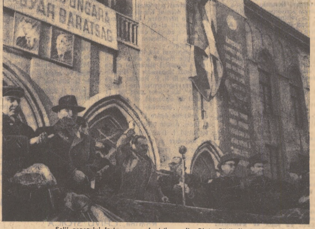
Solii poporului fratelui ungar, la tribuna din Piața Gării din Iași

Un alt rezultat important obținut în urma experimentării a fost însăși creșterea cifrelor muncitorilor, în special a muncitorilor care realizează cifrele mici.