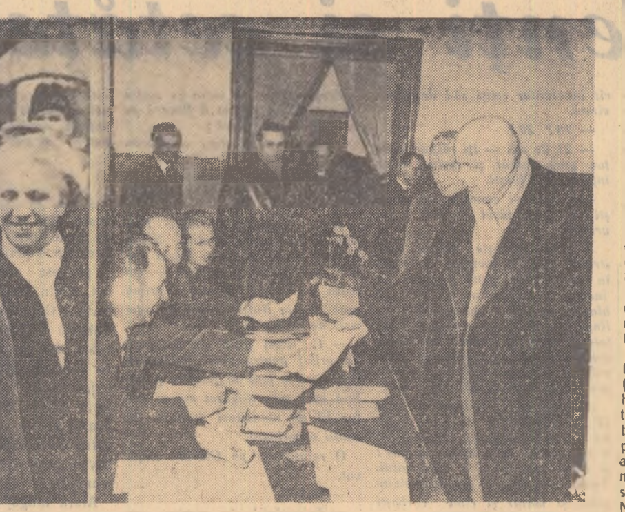
Tovarășul Chivu Stoica primind buletinul de vot