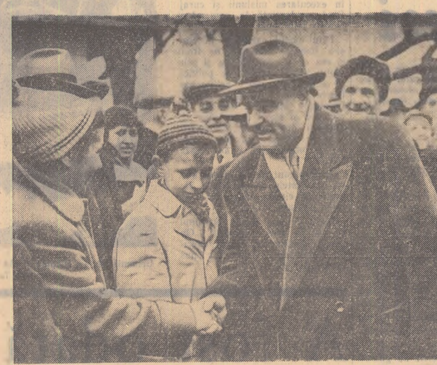
Tovarășul Gh. Gheorghiu-Dej în mijlocul cetățenilor