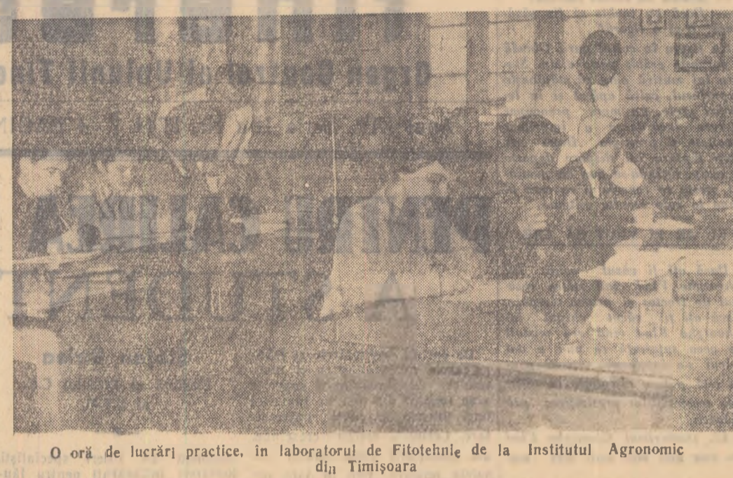
O oră de lucrări practice, în laboratorul de Fitotehnie de la Institutul Agronomic din Timișoara