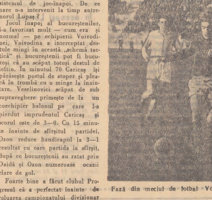
Fază din meciul de fotbal Voivodina—Progresul București.