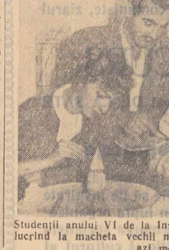
Studenții anului VI de la Institutul de Arhitectură din București lucrînd la macheta vechii mîini stiri fortificate din Prejmer — azi monument istoric