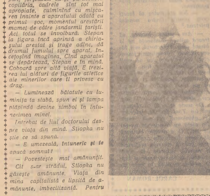
O scenă din film