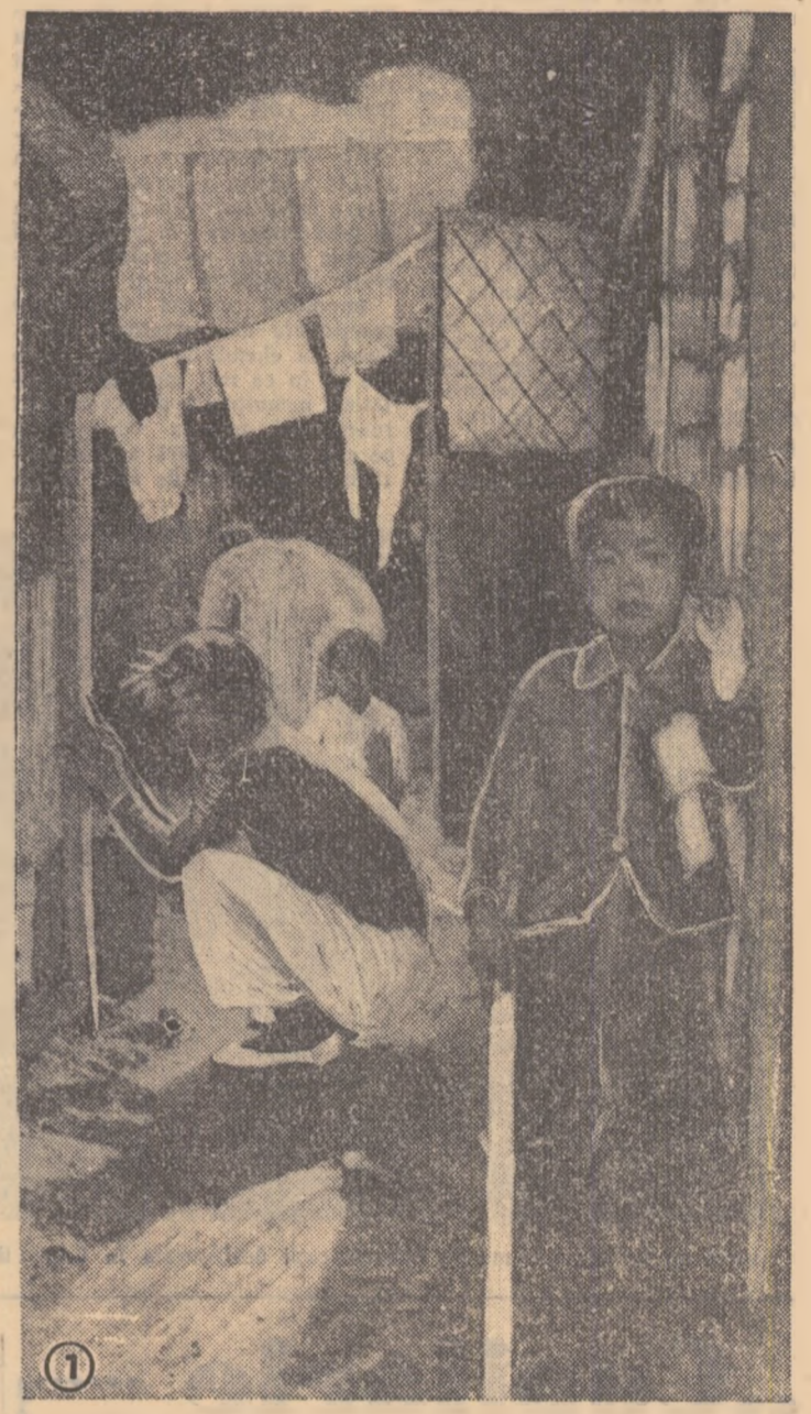
Trăind în groapa de gunoai din apropierea orașului Pusan, multe sute de familii folosesc drept locuințe corturi mizere sau cocioabe încropite din resturi de lăzi. Ei își duc viața în mijlocul unei murdării de neînchipuit, (fotografia nr. 1), căci în locuințele bune stau marionetele imperialiștilor americani.