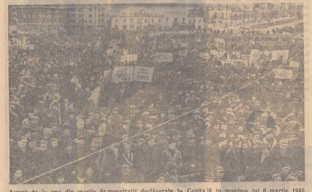
Aspect de la una din marile demonstrații desfășurate în Capitală în preajma lui 6 martie 1945