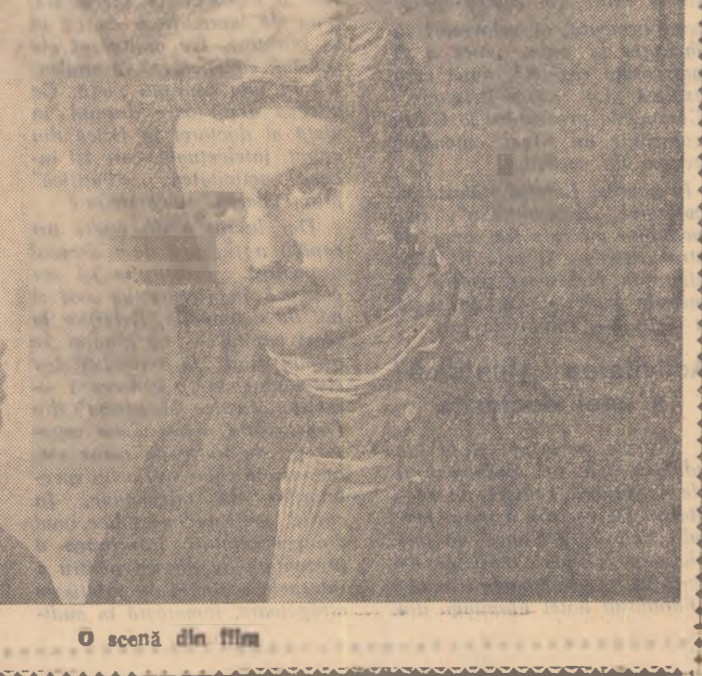
O scenă din film