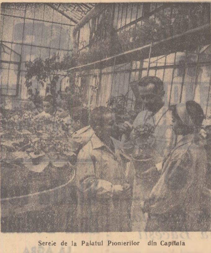
Serie de la Palatul Pioneerilor din Capitala