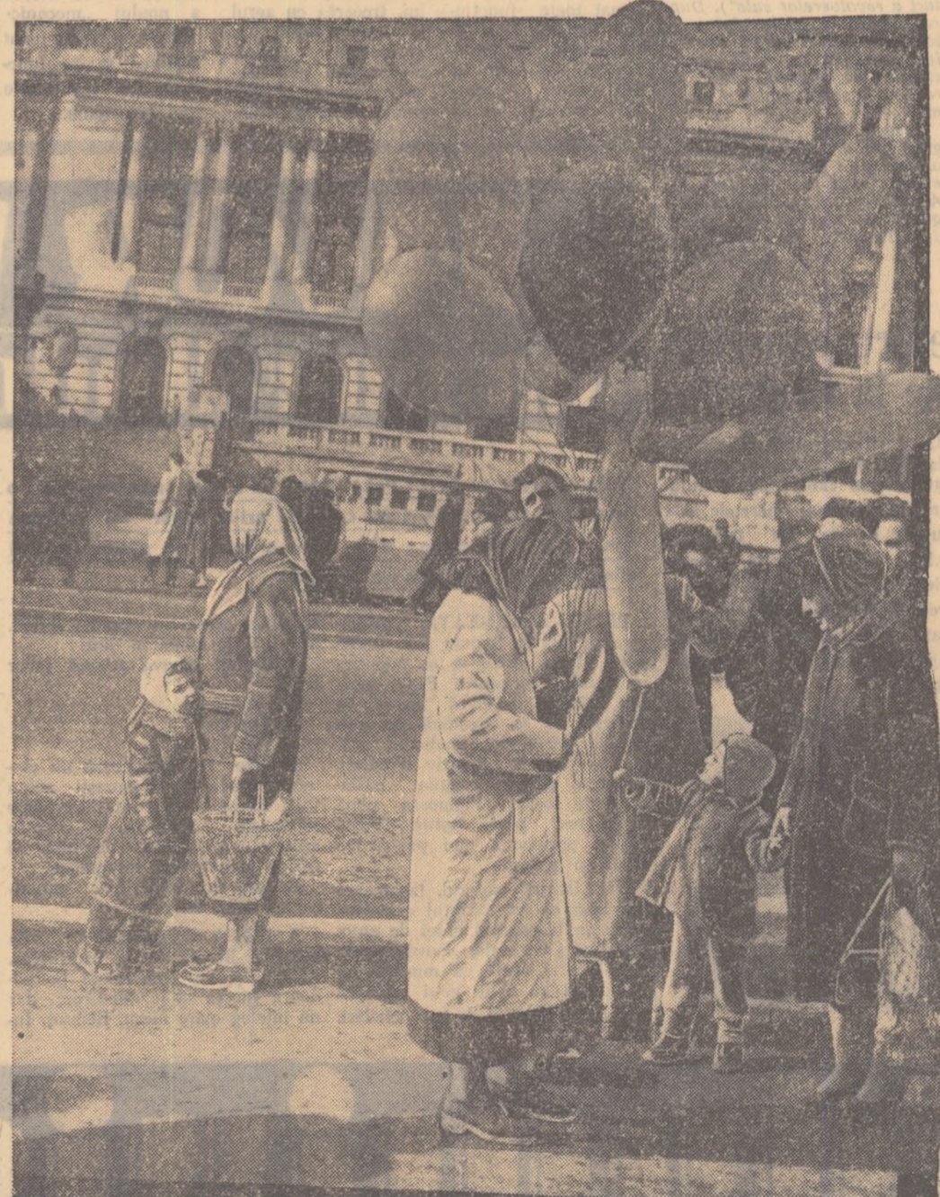
— Bunăno, mai la-mi unul!... N-am să-l sparg...

Sînt în curs de instalare și utilajele necesare fabricării de acid azotic diluat.