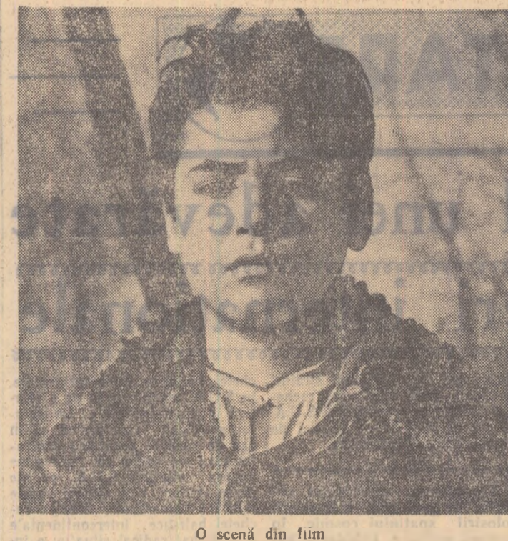
O scenă din film

Comitetul regional își propune să intensifice acțiunea stringerii spicelor, în 1960, comitetul regional își propune să ajungă să strângă 30 de vagoane de boabe de grâu din spice. Vorbitorii au subliniat în plenary că experiența echipelor de tineret din C.A.C. trebuie extinsă pentru că ele dau bune rezultate, a organizațiilor de bază U.T.M. S-a prevăzut în 1960 de către plenary ca în anul acesta să se creeze 520 echipe de tineret în G.A.C. Vorbitorii au subliniat totodată că echipele de tineret trebuie ajutate pentru a se transforma în echipe pentru obținerea de producții record la hectar.