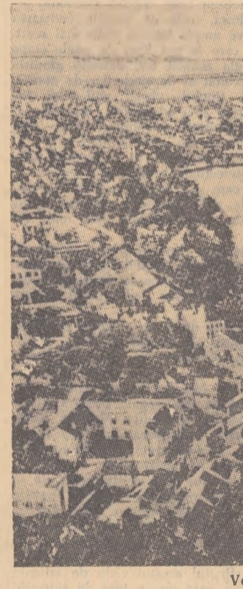
Vedere din Hanoi capitala R. D. Vietnam

Doacă aruncăm o privire retrospectivă asupra rezultatelor obținute în ultimii trei ani, vedem că datorită grijii partidului și guvernului, a sprijinului dat de întregul popor, a eforturilor depuse de toate cadrele de învățămînt și la care s-a adăugat ajutorul frăcesc al țării socialiste, astăzi noi putem să ne mîndrim că am obținut succese importante. Realizările arătate constituie deșigur o oglindă a hotărîrii în muncă pentru reconstruirea țării, a aptitudinilor creatoare ale poporului nostru puse în slujba socialismului.