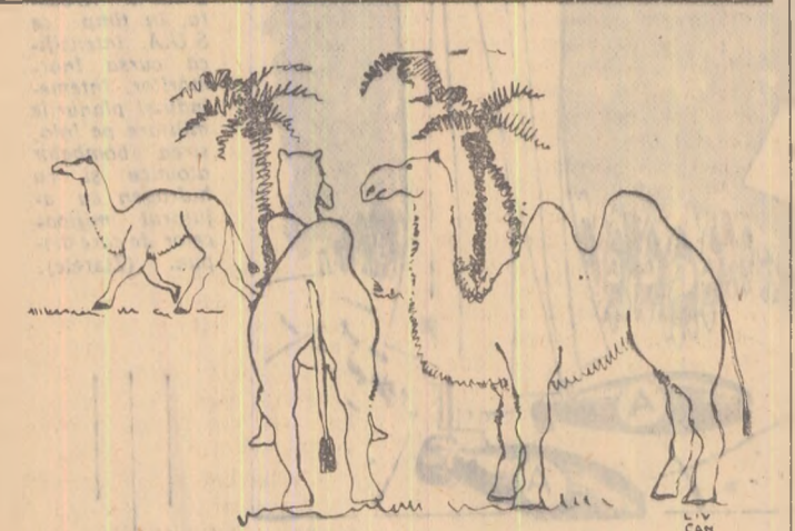
„Săraca, ce diformă e!”

O expediție de arheologi sovietici a descoperit vestigii ale omului din Neanderthal in Uzbekistan, la 100 km. de Tașkent. După cum se știe, oamenii din Neanderthal au trăit acum mai bine de 50.000 de ani și se numără printre cel mai îndepărtați strămoși ai omului de astăzi. Arheologii sovietici au descoperit aceste vestigii într-o grotă ai cărei pereți sînt acoperiți cu picturi de animale in mărime naturală. Este pentru inția oară cînd se găsesc urme ale omului din Neanderthal in Asia Centrală.