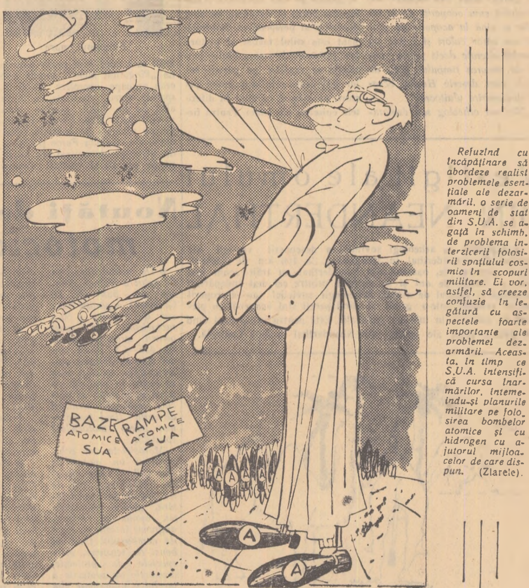
DULLES: In cosmos, pace — pe pămînt, atomice! Desen de NELL COBAR

Membrii delegației Comitetului Central al U.T.C. din R. P. Ungară, care la invitația C.C. al U.T.M. fac o vizită în țara noastră, au sosit vineri la Iași. Oaspeții au vizitat instituții de cultură și monumente istorice din localitate: Palatul Culturii, Universitatea „Al. I. Cuza”, Institutul Agronomic „Ion Ionescu de la Brad”, Biserica Trei Ierarhi etc. și fabrica de antibiotice. Pretutindeni oaspeții au fost primiți cu multă căldură.