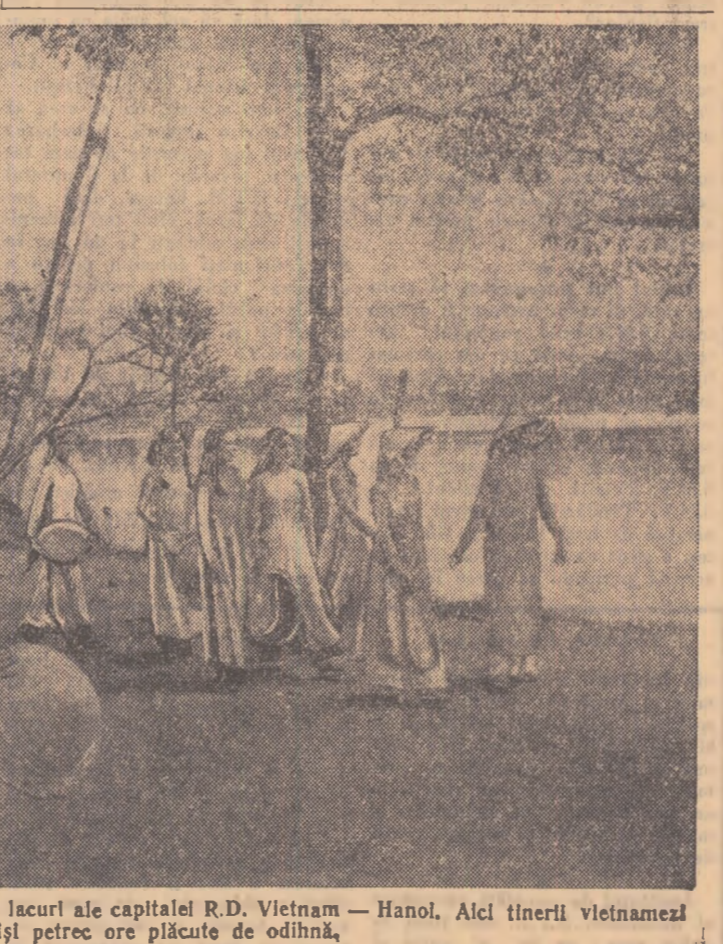
Hoan-Kiem, unul din pîrtoștii lacurii ale capitalei R.D. Vietnam...