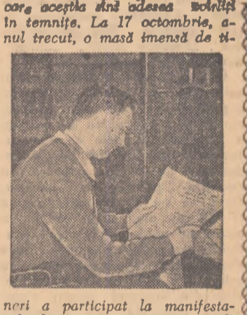
care acceptă din adesea vorbiri în temă. La 17 octombrie, anul trecut, o masă imensă de t-