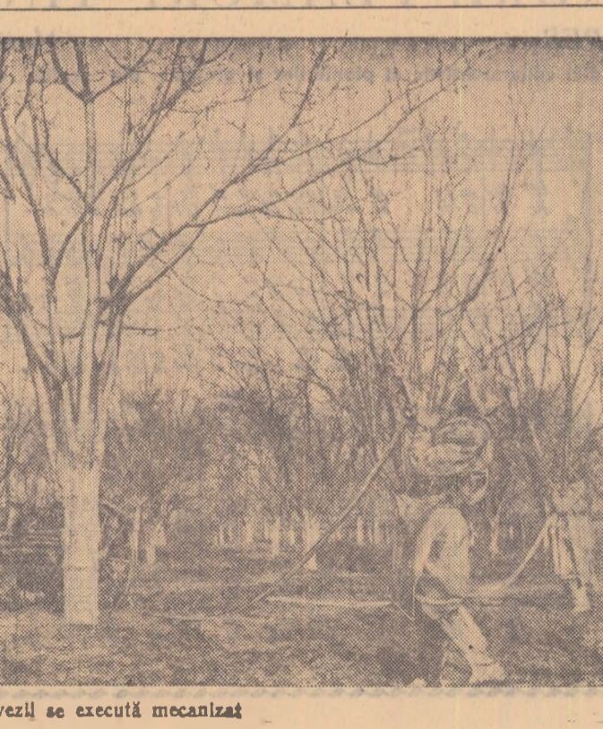
La G.A.S. Mogoșoaia stropitul livezilor se execută mecanizat

Situația chestiunii în discuție. Într-un cadru economic și poli-