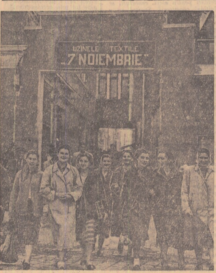
După o zi de muncă tineretele muncitoare de la „7 Noiembrie” din Capitală pleacă spre casă, mulțumite de realizările obținute