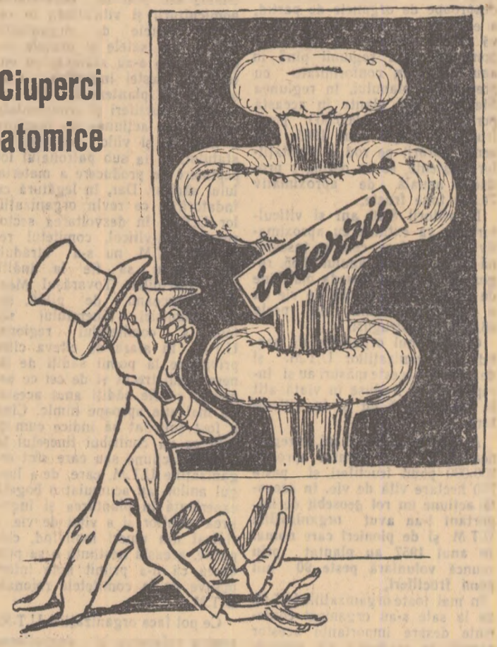
TRUSTMANUL: — Ce au contra lor, sînt doar comestibile: pe mine asta mă hrănesc!...