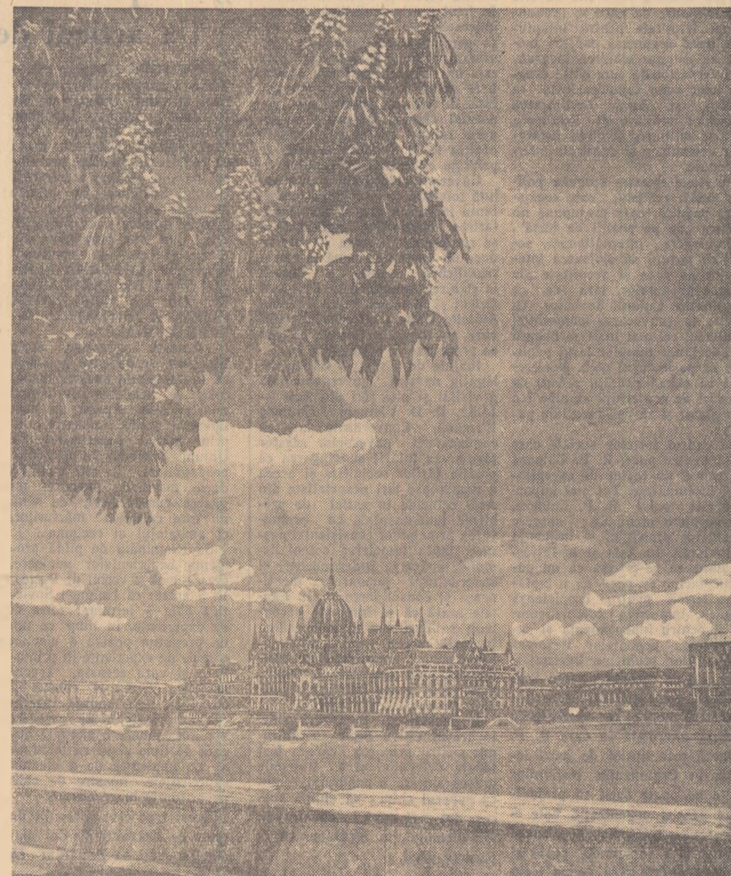
Vedere din Budapesta, Palatul Parlamentului.