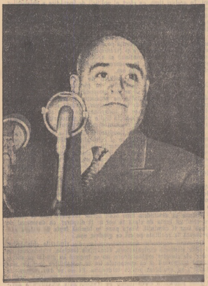
Tovarășul Gh. Gheorghiu-Dej rostindu-și expunerea