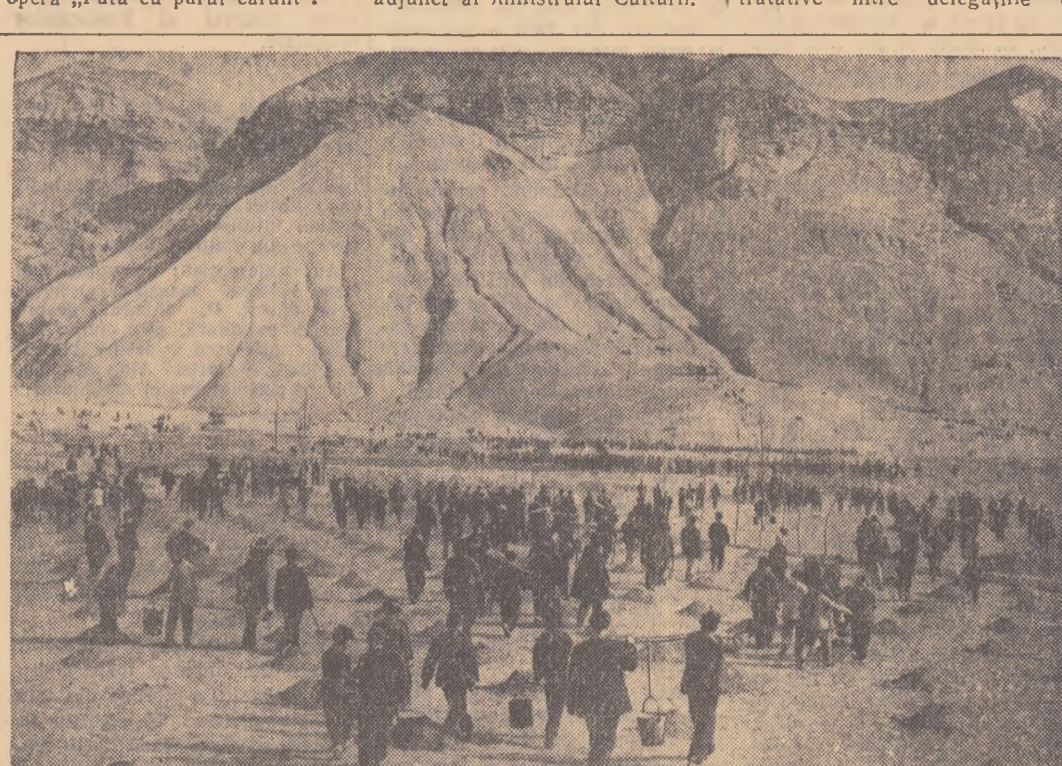
În fotografie: Lucrările de împădurire din provincia Chinghăi făcute de Liga tinerilor comunisti din orașul Sing (R. P. Chineză)