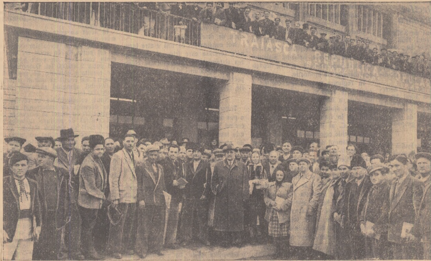
După încheierea lucrărilor consfățuirii, înaintea tradiționalului „La revedere”.