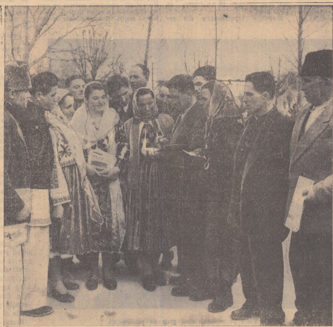
Un grup de delegați din regiunea Pitești