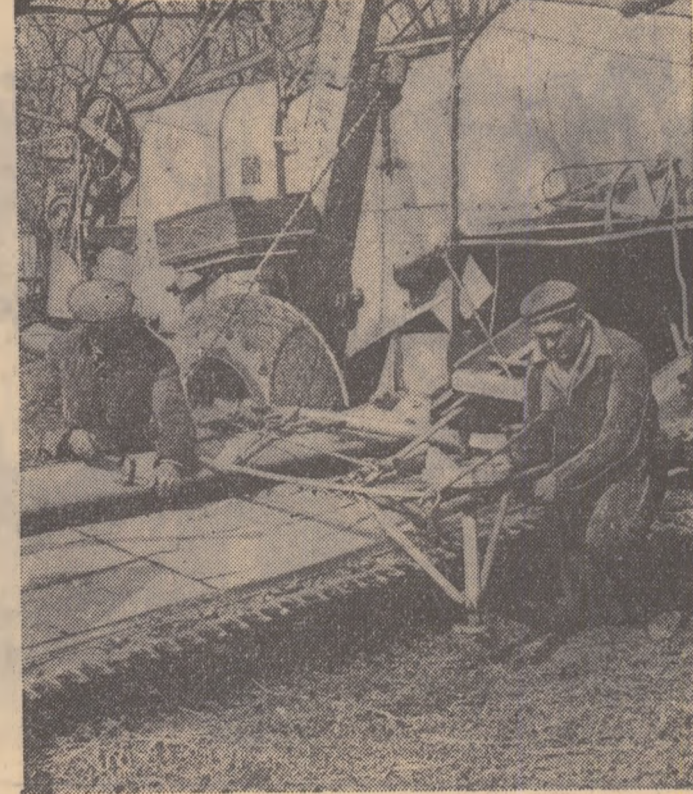
Gospodarii harnici — se spune — își fac larma cărui și vara sanle. Așa și cel de la G.A.S. Drăgănești, reginea Pitești. El repară încă de pe acum combinele...