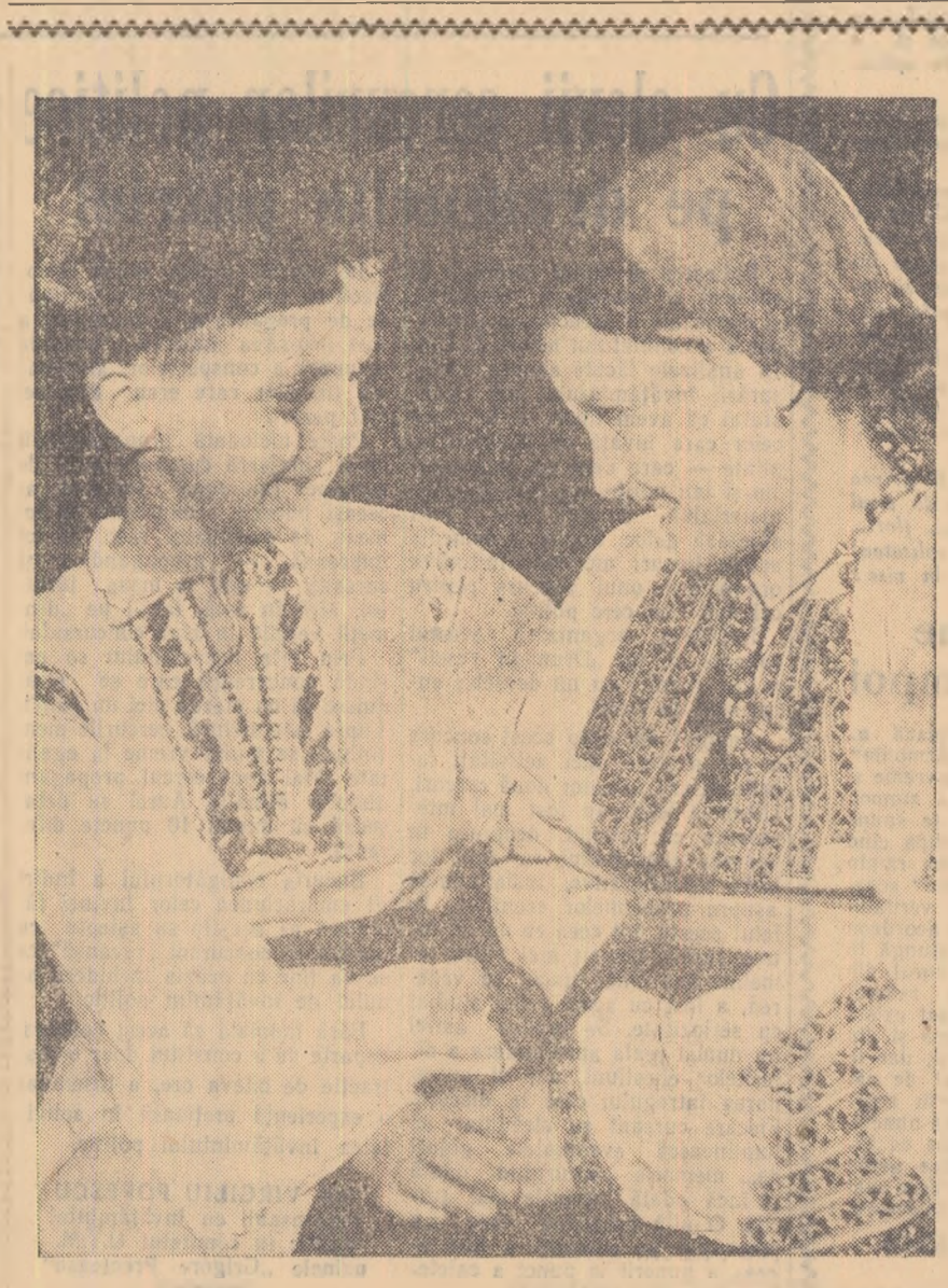
Vîrsta de aur