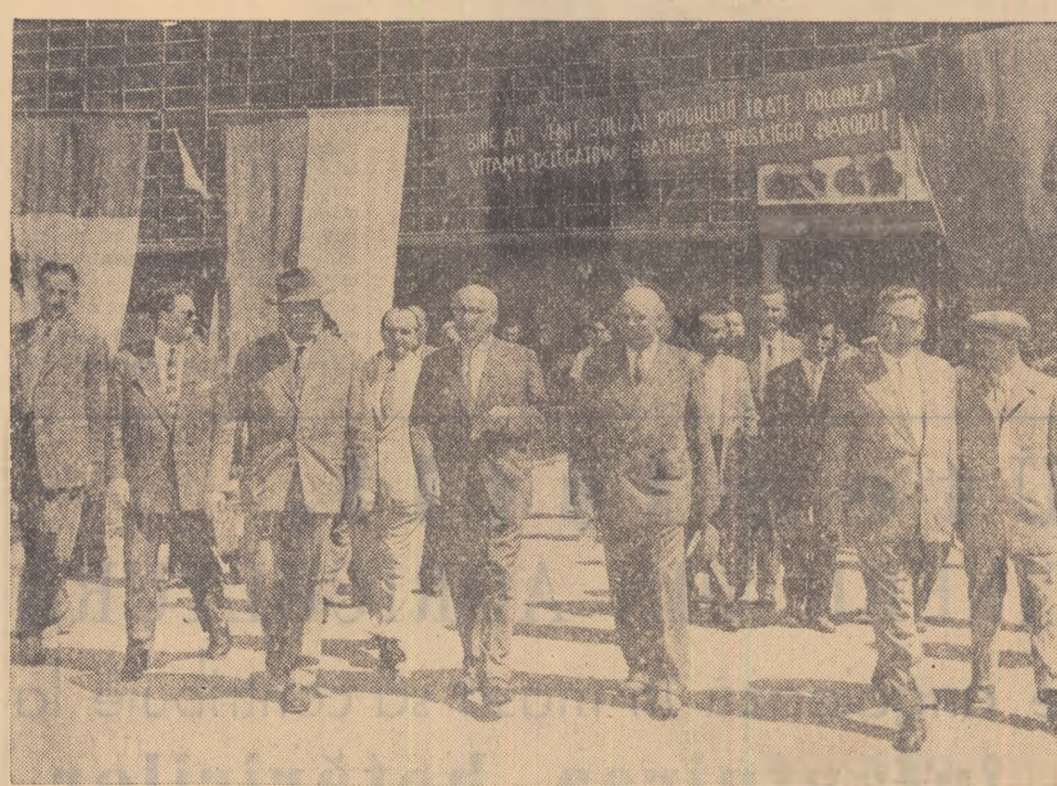
Vizita inaltilor oaspeți la uzinele „Republica”

prietenie, Republica Populară Polonă. Primiți cu multă căldură de muncitorii uzinelor, membrii delegației de partid și guvernamentale poloneze au vizitat mai multe sectoare de producție ale întreprinderii interesindu-se îndeeaproape de procesul tehnologic, de gradul de calificare al muncitorilor, de colaborarea lor cu alte întreprinderi metalurgice din țară. La plecare în semn de adîncă considerație, muncitorii uzinelor au oferit tovarășilor Wladyslaw Gomulka și Josef Cyrankiewicz buchete de flori și albume de fotografii reprezentînd aspecte din viața și munca lor.