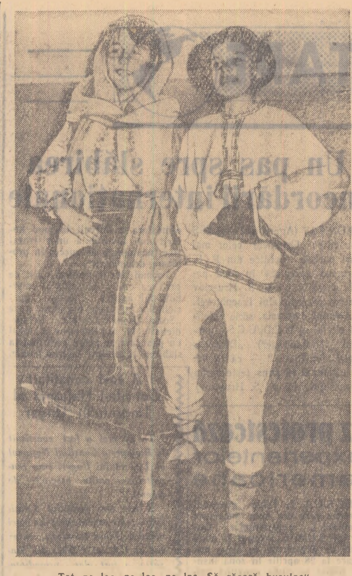
„Tot pe loc, pe loc, pe loc Să răsară busuloc!”