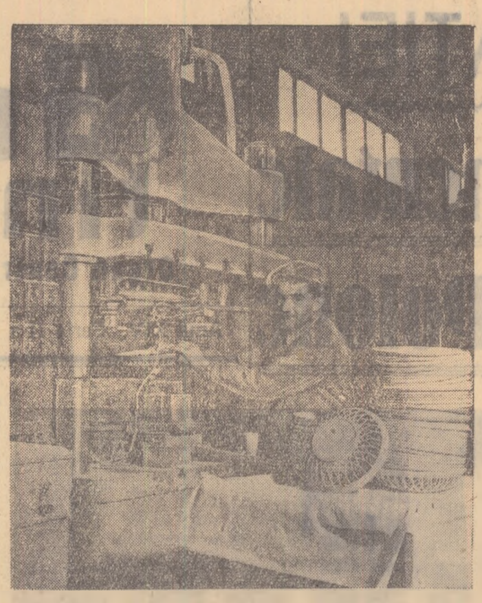
La fabrica de mase plastice din cadrul Combinatului chimic nr. 1, se lucrează la presarea coșulețelor pentru pline.