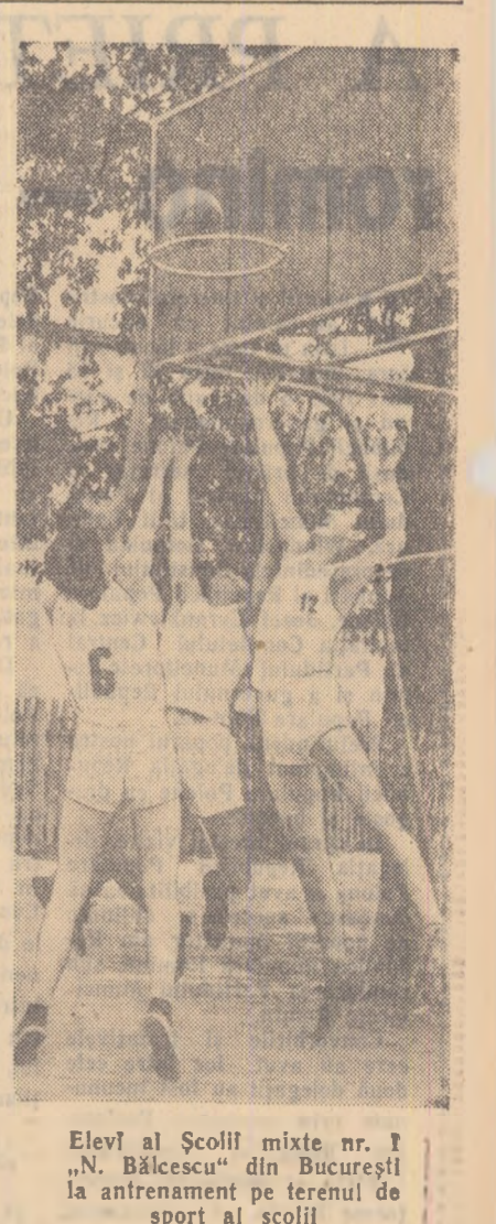
Elevi al Școlii mixte nr. 1 „N. Bălcescu” din București la antrenamentul pe terenul de sport al școlii