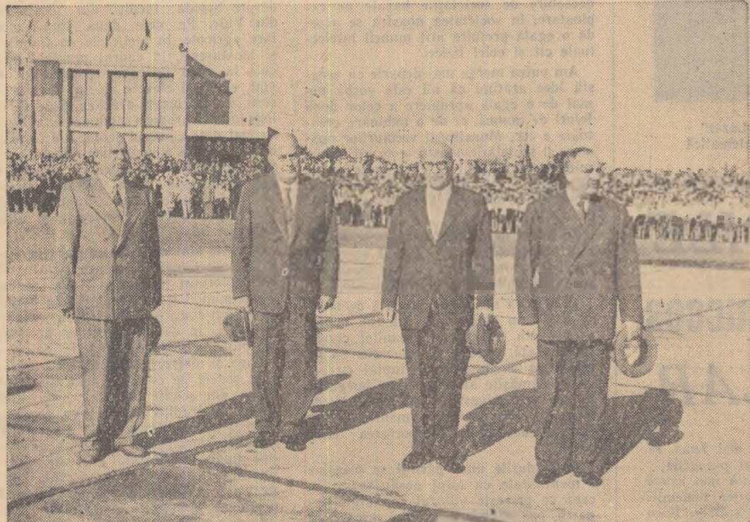
Pe aeroportul Băneasa, înainte de plecare