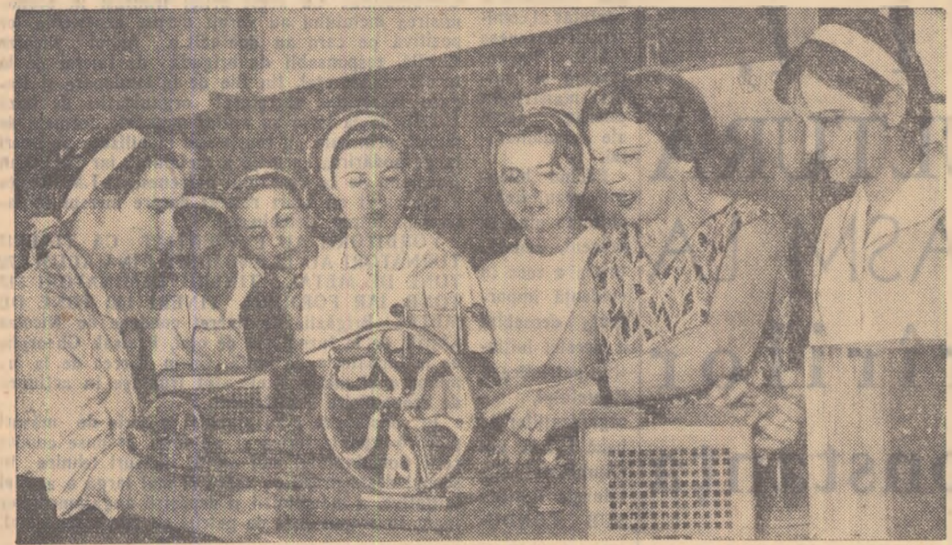
Elevete clasei X-a a Școlii medii nr. 20 „Gh. Șincai” în laboratorul de fizică al școlii.

Școala, familia și organizația U.T.M. trebuie să fie deosebit de atente însă și la acei care — ani de ani — în speranța intrării în învățămîntul superior — fără să lupte pentru însușirea cunoștințelor necesare — își înroșesc, zadarnic, uneori în ocupații degradante, cei mai prețioși ani ai vieții, constituind o povară pentru familie și societate. Aceștia trebuie îndrumați cu seriozitate spre munca productivă, ajutați să-și înțeleagă datoria de a sluji patria acolo unde este nevoie de ei.