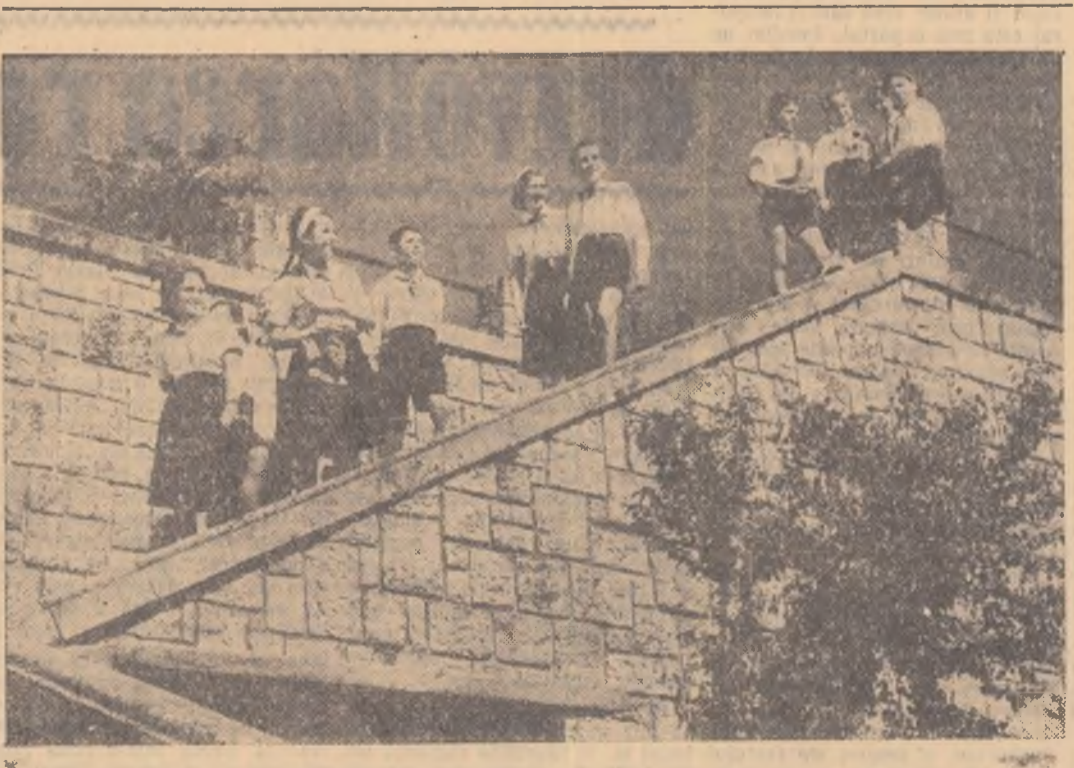
Plecările de la Școala Mixtă nr. 179 Grivița Roșie, din Capitală în excursie la Băneasa

ber, stăpîn pe forța lui de muncă, pe inteligența lui, calea cea mai potrivită pentru a se face util întregii societăți și pentru a-și asigura o viață civilizată. N-au trecut mulți ani de cînd naționalizarea mijloacelor de producție a răsturnat singeroasele tradiții ale exploatareii capitaliste și a pus clasa muncitoare, stăpîn pe forța lui de muncă, pe inteligența lui, calea cea mai potrivită pentru a se face util întregii societăți și pentru a-și asigura o viață civilizată. Nici un exemplu nu mi se pare mai grăitor pentru aceasta decît situația tineretului. Cîți ani de chin și umilință, cîtă trudă de rob trebuia înaște nu numai ca să „furi” tainele unei meserii, dar apoi, lăsînd anii să treacă, să-și se recunoască pregătirea și posibilitățile? Să mergem astăzi în țara noastră, oriunde ne poartă pașii: în fabrici, pe ogoare, în laboratoarele sa-