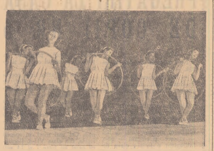
La Școala medie „Spiru Haret” din București, se stabilește itinerariul unei excursii științifice.

În regiuni s-au discutat de-acum planurile de activitate pe timpul vacanței. Activități care au devenit tradiționale în timpul vacanțelor vor fi organizate și anul acesta. Și în această vacanță, elevii vor participa la acțiunile patriotice de sprijinire a muncilor agricole de vară. Un număr de 15.000 de elevi vor fi cuprinși în taberele de pe lângă G.A.S. și șantierelor locale. De asemenea, vor fi organizate și brigăzi permanente cu durata de 7 zile. În aceste brigăzi vor fi cuprinși în primul rînd elevii care vor rămîne în orașele și satele din apropierea G.A.S.-urilor. Organizațiile U.T.M., cu sprijinul secțiilor de învățămînt ale statului populare și al conducere-