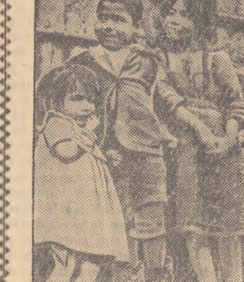
Copii din Africa de Sud se zbat în mizerie, pradă foametei și bolilor