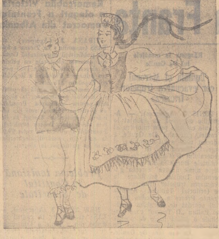
Dans lituanian. Desen de Leticia Ignat-Homoriceanu