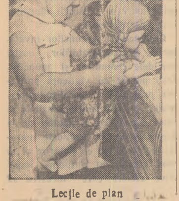
Lecție de pian