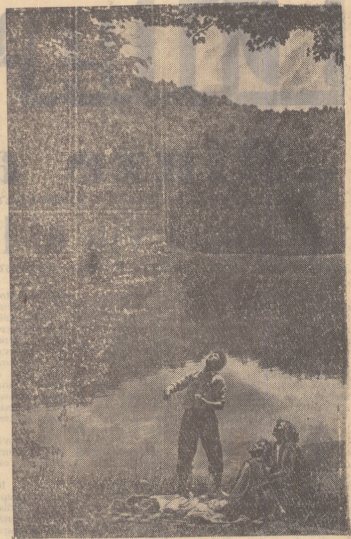
Elvi din Anina în excursie