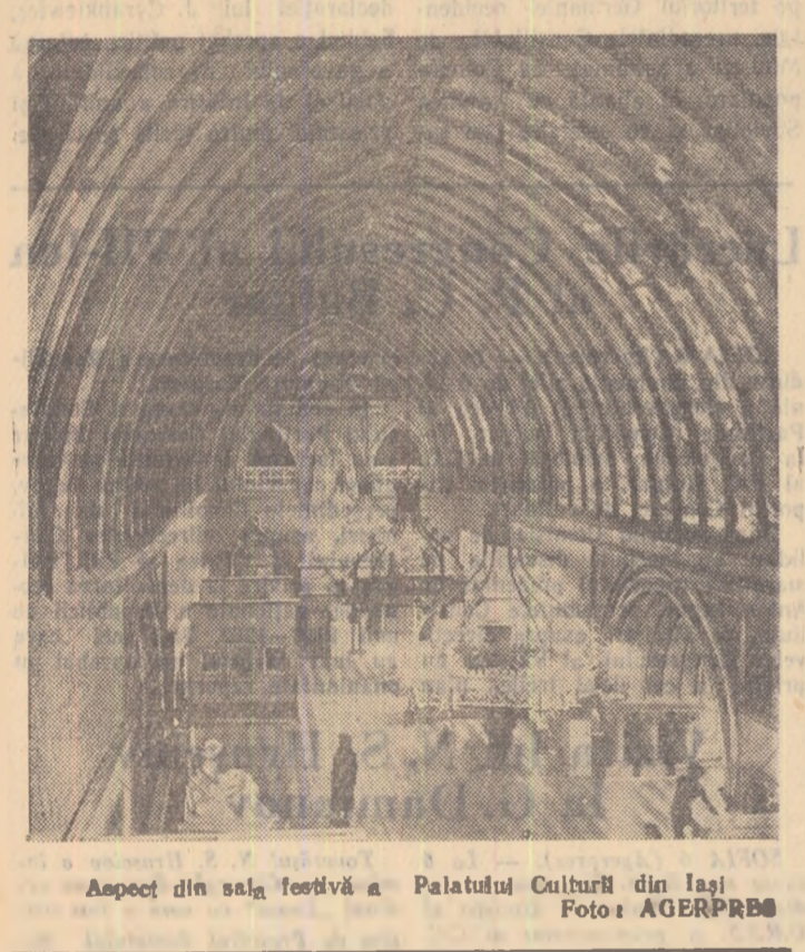
Aspect din sala festivă a Palatului Cultural din Iași.